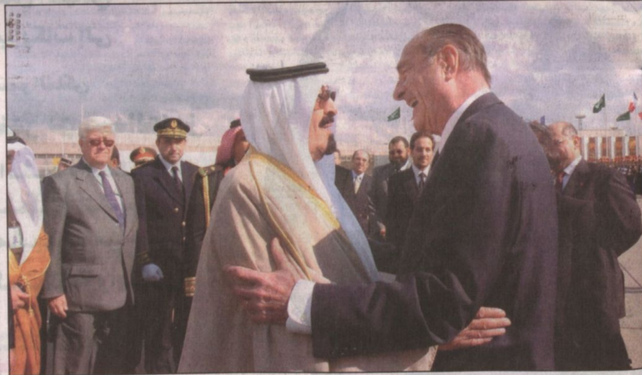
الرئيس الفرنسي جاك شيراك يودع ولي العهد لدى مغادرة سموه باريس.

كتاب - المحرر السياسي ■ الزيارة التاريخية التي اداها صاحب السمو الملكي أمير عبدالله بن عبدالعزيز ولي العهد نائب رئيس مجلس الوزراء ورئيس الحرس الوطني الى فرنسا سوف تدفع بالتعاون بين البلدين في كافة المجالات الى آفاق أرحب خاصة وان هذا التعاون يطلق من علاقات تاريخية قديمة تحولت من كونها علاقات صداقة وتعاون الى شراكة استراتيجية مهمة بالنسبة للجانبين بل والى اتاحة الفرصة لكل من البلدين للانفتاح على دول الجوار بشكل عام بسبب هذه العلاقة الخاصة بين البلدين. وادا كانت القيادة السعودية على مدى سنوات طويلة كانت على تواصل دائم مع القيادات الفرنسية المتعاقبة مما اسس لهذه العلاقة المميزة فإن زيارة الأمير عبدالله التي اختتمت يوم الجمعة قد دعمت هذه العلاقة وسعت الى تقوية أركانها خاصة مع الاتصالات الدائمة والمستمرة في خصوص