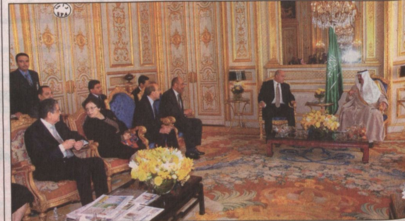
سمو ولي العهد يستقبل السفراء العرب في باريس.

كتاب - المحرر السياسي ■ الزيارة التاريخية التي اداها صاحب السمو الملكي أمير عبدالله بن عبدالعزيز ولي العهد نائب رئيس مجلس الوزراء ورئيس الحرس الوطني الى فرنسا سوف تدفع بالتعاون بين البلدين في كافة المجالات الى آفاق أرحب خاصة وان هذا التعاون يطلق من علاقات تاريخية قديمة تحولت من كونها علاقات صداقة وتعاون الى شراكة استراتيجية مهمة بالنسبة للجانبين بل والى اتاحة الفرصة لكل من البلدين للانفتاح على دول الجوار بشكل عام بسبب هذه العلاقة الخاصة بين البلدين. وادا كانت القيادة السعودية على مدى سنوات طويلة كانت على تواصل دائم مع القيادات الفرنسية المتعاقبة مما اسس لهذه العلاقة المميزة فإن زيارة الأمير عبدالله التي اختتمت يوم الجمعة قد دعمت هذه العلاقة وسعت الى تقوية أركانها خاصة مع الاتصالات الدائمة والمستمرة في خصوص