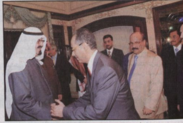
الأمير عبدالله خلال الاستقبال.