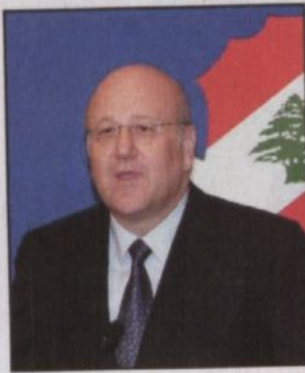
ميفاتي يتحدث للمساحيين بعد تكليفه تشكيل الحكومة (أ.ه.ب).

تغيرت بشكل أساسي في لبنان ملاحظاً بأن المعارضة شاركت في الاستشارات التأسيسية للمرة الأولى وسمت رئيساً للحكومة، ووصف يوم الاستشارات بأنه «يوم عظيم للبنان وللديمقراطية التي عادت إليه». وأكد ميفاتي التزامه بتطبيق اتفاق الطائف كاملاً، لافتاً إلى أنه سيكون لمجلس الوزراء الدور الأساسي في موضوع إقالة قادة الأجهزة الأمنية، مذكراً أنه من حيث المبدأ مع وضع رؤساء الأجهزة بالتصرف لتسهيل مهمة لجنة التحقيق الدولية. وأكد أن المهمة الأساسية للحكومة في الوقت الراهن، ستكون إجراء انتخابات نزيهة بالسرعة المطلوبة.