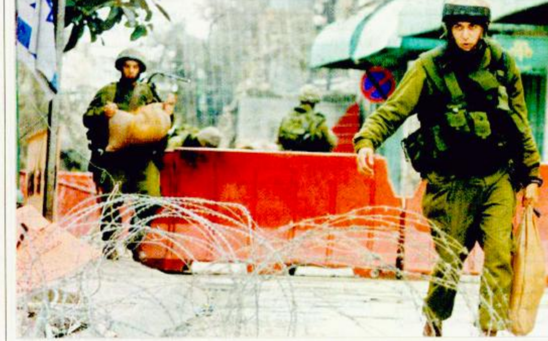
جنود الاحتلال يضعون الاسلاك الشائكة والعوائق أمام حركة تنقلات الفلسطينيين

أعربت روسيا أمس الأربعاء عن «الأسف» لقرار واشنطن البدء بنشر درع مضاد للصواريخ، واتهمت الولايات المتحدة بدفع أصدقائها وشركائها في سياق في مجال الأسلحة الاستراتيجية الدفاعية. وقال بيان صادر عن وزارة الخارجية الروسية ان «موسكو تلاحظ بأسف تكثيف محاولات الولايات المتحدة لإقامة ما اصطلح على تسميته (الدفاع الشامل المضاد للصواريخ)» قبل أن تشدد على ان «تنفيذ هذه الخطط يدخل في مرحلة جديدة من زعزعة الاستقرار». ويعد ان أشارت إلى مشاريع التعاون بين روسيا والولايات المتحدة خصوصاً في مجال الدفاع المضاد للصواريخ غير الاستراتيجية أعربت روسيا عن الأمل بأن تعبر الولايات المتحدة «اهتماماً أساسياً لبرنامج الشراكة الاستراتيجية هذا». كما أضاف البيان ان روسيا أعربت عن الأمل بأن تقوم الولايات المتحدة بدفع أصدقائها وشركائها نحو هذا البرنامج وليس نحو سياق مزعزع للاستقرار في الأسلحة الاستراتيجية الدفاعية (بما فيها في الفضاء). الأمير عبدالله بن عبدالعزيز ١٧ طالع ص