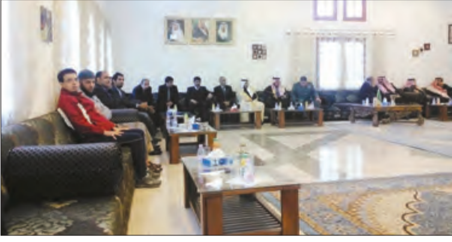
جانب من الغزاء

القاهرة - واس نعى مجلس الشباب العربي وفاة الملك عبدالله بن عبدالعزيز آل سعود -رحمه الله-، معرباً عن خالص الغزاء للعائلة المالكة الكريمة وشعب المملكة والامتين الاسلامية والعربية في المصاب والجل. ودعا المجلس في بيان له المولى عز وجل أن يرحمه ويغفر له ويسكنه فسيح جناته وأن يجزيه خير الجزاء وأن ينزله منازل النبيين والصديقين والأبرار.