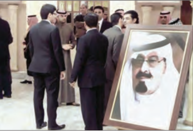
مدخل مجلس الوزراء