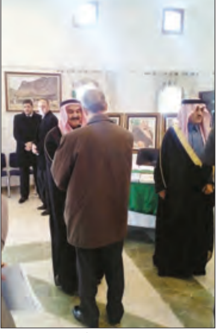
السفير قطان مستقبلاً الغزين

بالسفارة عبدالله المرشد إن إنجازات الملك عبدالله بن عبد العزيز -رحمه الله- تحكي إخلاصه وتفانيه، وإن الكلمات لا تفي المغفور له حقه، فالراحل تملأ بصماته ربوع المملكة وحينما نولي النظر نجد إنجازاته تحكي قصة جهده في خدمة المواطن السعودي، كان بحق بمكانة الوالد لكل السعوديين، وكل ما نستطيع فعله الآن هو الدعاء له بالرحمة والمغفرة. وتحدث لـ"الرياض" أستاذ الإعلام بجامعة الجزائر الدكتور محمد لعقاب فقال إن جهود الملك عبدالله -رحمه الله- شاهدة على خدمته للإسلام، وأن الامة العربية والاسلامية فقدت شخصية سياسية كبيرة بدليل أن السياسة السعودية اتسمت في عهده بالحكمة والهدوء. لقد كان الراحل علامة فارقة فيما يتعلق بخدمة الإسلام والمسلمين عبر العالم، ولعب دوراً كبيراً في تجنب الصراعات البينية بين الدول العربية، وحرص على تجاوز الخلافات بين المملكة ودول الجوار، وكان -رحمه الله- شخصية جامعة ومتزنة أفنى عمله في خدمة المسلمين ولعل أثاره شاهدة على إنجازاته من مساجد ومدارس ومستشفيات ومراكز علمية في عدد كبير من الدول العربية والاسلامية وفي عواصم الغرب على حد سواء. رحم الله الفقيد.