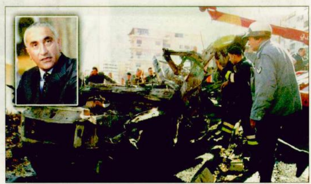
فرق الإنقاذ اللبنانية حول حطام سيارة حبيقة وفي الإطار صورة الوزير

اتهمت لبنان أمس الخميس ضمياً إسرائيل اغتيال الوزير السابق ايلي حبيقة. فقد أعلن الرئيس اللبناني اميل لحود في بيان صادر عن رئاسة الجمهورية إدانته لاغتيال الوزير والنائب السابق ايلي حبيقة واعتبره جريمة متعددة الاهداف. وخصوصا لضعه من الادلاء بافادته امام المحكمة في بروكسل في القضية المرفوعة ضد رئيس الوزراء الاسرائيلي ارييل شارون. واعلن وزير الداخلية اللبناني الياس المر ان مقتل ايلي حبيقة له علاقة ولا شك بالدعوى ضد (رئيس الوزراء الاسرائيلي ارييل) شارون في بروكسل. وقال الوزير المر للصحافيين في ختام اجتماع مجلس الامن المركزي الذي يضم كافة الأجهزة الأمنية في لبنان لا شك ان الوضع له علاقة بالدعوى ضد شارون في بروكسل وبموضوعات أخرى تحمل توقيع اسرائيل وعمالها. وكان مسؤول فلسطيني قد حمل اسرائيل مسؤولية اغتيال الوزير اللبناني السابق ايلي حبيقة وذلك لانقاذ رئيس وزرائها الراهبي ارييل شارون من الاذانة من جريمة صبرا وشاتيلا امام محكمة بلجيكية. وقال العميد سلمان ابو العيينه لفرانس برس في اول تعليق فلسطيني على عملية الاغتيال ان جهاز الموساد