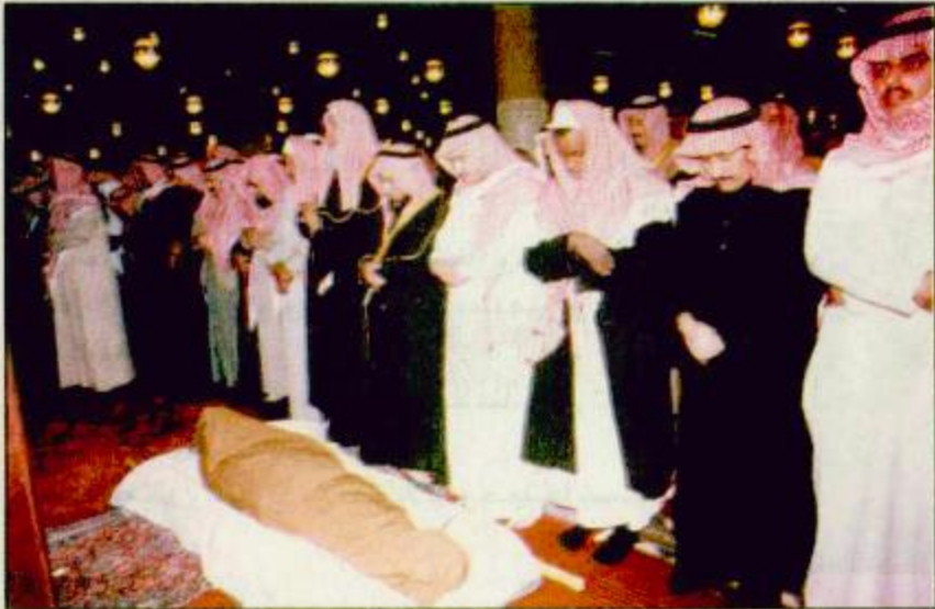
المصلون يؤدون صلاة الميت على جثمان الفقيد

صور تنشر الجزيرة بنشرها للفقيد (تفاصيل ص: 2 / 3 / 6 / 7)