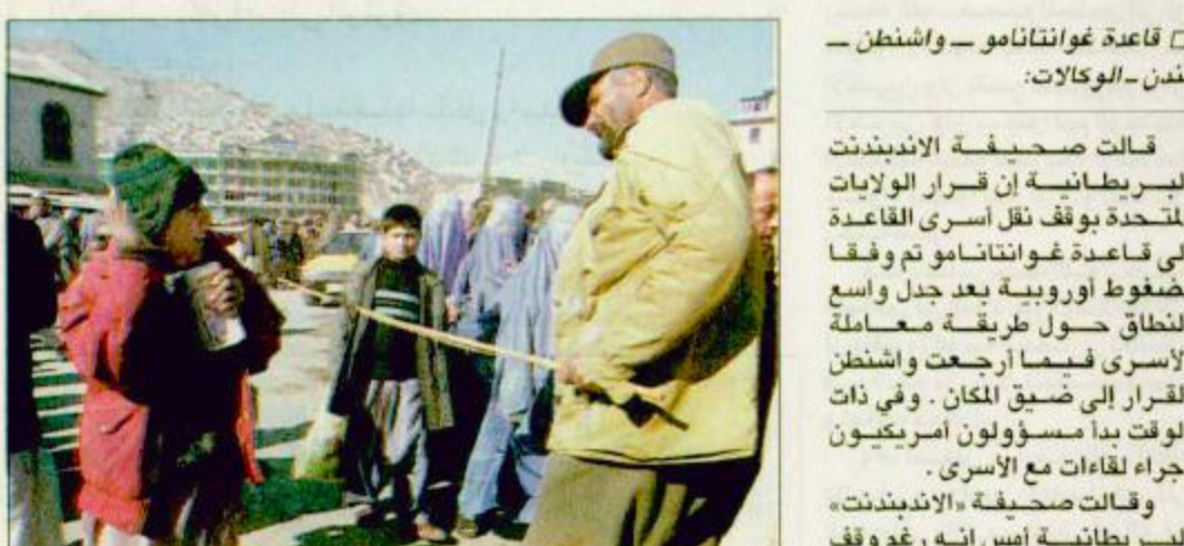
شرطي افغانى يضرب بالعصا تاجر عملة في اسواق كابول