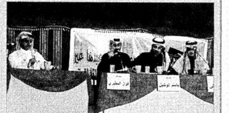
فرسان الأمسية الشباب