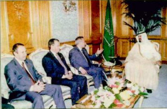
نائب خادم الحرمين الشريفين مستنقيل وزير الداخلية وعضو العدل العرب واس