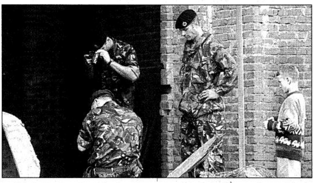
□ بريشتينا، كوسوفو، 1 أ.ش. جنود بريشتينيين من قوات حفظ السلام في كوسوفو يتفحصون بقايا جهاز تلفزيوني الذي وضع في مبنى أكاديمية الألبانية الأثوية الرئيسية في بريشتينا بعد الانفجار.

□ بريشتينا، 1 أ.ش. صرح رئيس أركان جيش تحرير كوسوفو الجيم شيكران أن جيش تحرير كوسوفو لا يعتزم التخلص من أسلحته ويعمل على أن يكون تنظيمًا عسكريًا على غرار الجيش الوطني الأمريكي من أجل الدفاع عن إقليم كوسوفو. وقال رايو لنين من شيكران الذي احتجزه الجنود الروس التابعون لقوات السلام لمدة عدة ساعات يوم أمس الأول قوله إن جيش تحرير كوسوفو يريد من المجتمع الدولي مساعدته ليكون جيشًا محترفًا على مستوى حلف الأطلسي وأن عملية التجريد من السلاح لا تترسى عليه. وأكد شيكران أن الأمر معقد على تحقيق الديمقراطية في صربيا مشيرًا إلى أن خطر الاحتلال الصربي قائم دائمًا كما أن مهمة جيش تحرير كوسوفو تتمثل في الدفاع عن جميع سكان الإقليم. هذا وعلى صعيد آخر قال شيكران إن جيشًا قويا هو مدينة بريشتينا عاصمة إقليم كوسوفو في ساعة مبكرة من صباح أمس الأحد. وهز الاندفاع الذي وقع الساعة ١٠:٢٠ صباحًا بالتوقيت المحلي مباني كثيرة وأدى إلى تصاعد عمود من الدخان فوق وسط المدينة. وشاور شيكران في الصباح الباكر مع فريق الكتيبة الألبانية الصربية الرئيسية في بريشتينا. وأطلق جنود من قوة كوفور لحفظ السلام بقيادة حلف شمال الأطلسي منطقة تقع قرب كشميتي. وقال المتحدث باسم كوفور إن تحقيقًا بنا.