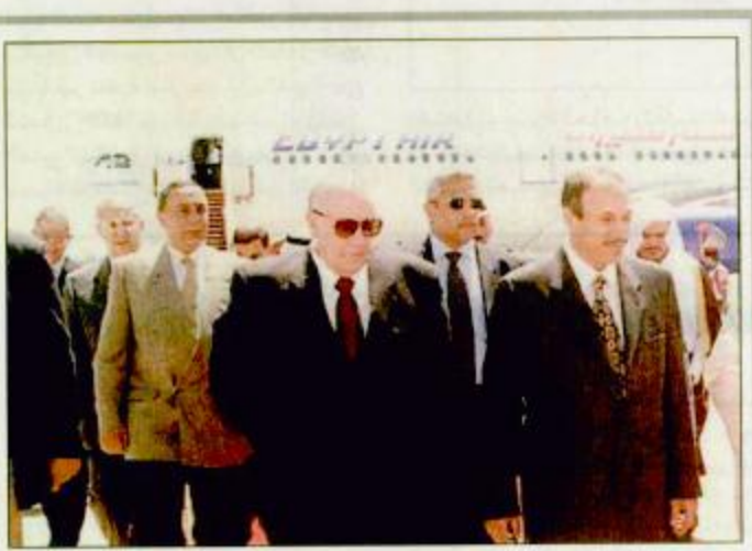
سمو الأمير نائب مستنقيل وزير الداخلية لصري واس