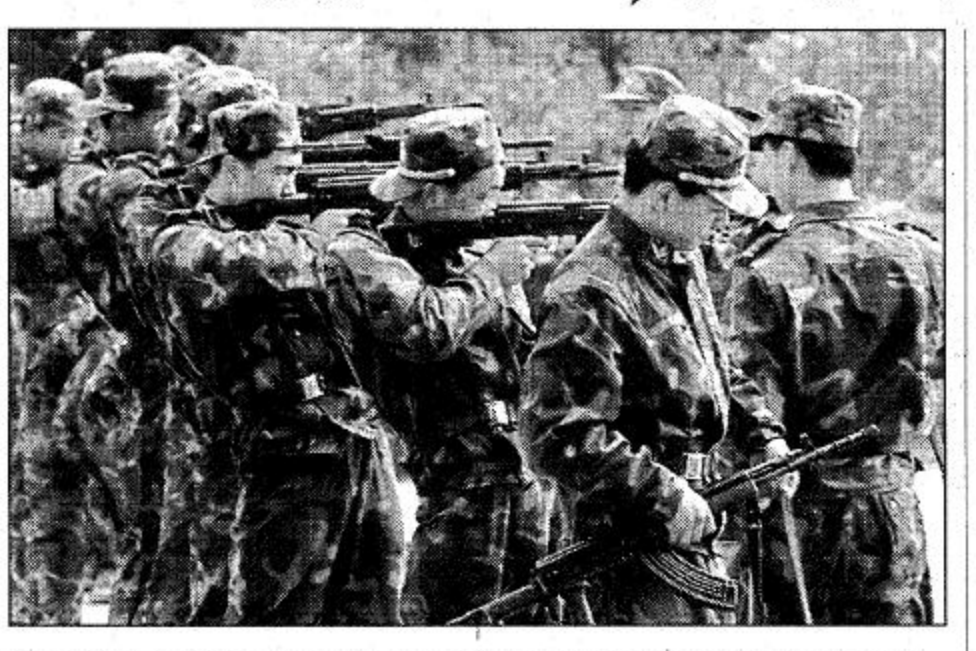
□ بكين - الصين، 1 أ.ش. جنود من قوات جيش التحرير الشعبي الصيني يتدربون على الرماية في مجمع لكتفقات العسكري في بكين احتفالاً بالذكرى الثانية والعشرين للجيش.