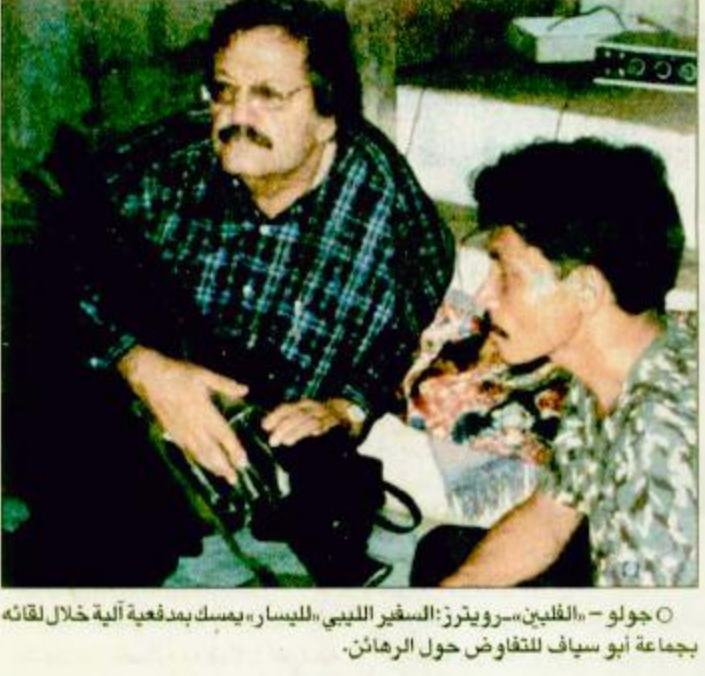
○ جولو - «الفلين» رويترز: السفير الليبي، الليسان، يسكب بدفعية آلية خلال لقائه بجماعة أبو سيف للتفاوض حول الرهائن.

○ زامبونغا - الوكالات: أعلن كبير المفاوضين الفلسطينيين روبرتو امينتاخادو أنه لم يكن بالإمكان الإفراج عن الرهائن أمس الخميس بسبب الأمطار الغزيرة التي حالت دون استخدام الطائرات للانتقال إلى جزيرة جولو. وقال امينتاخادو في تصريح صحفي أدلى به من مدينة زامبونغا حيث كان من المفترض أن تنقل المروحيات والطائرات المفاوضين إلى جزيرة جولو لتسلم الرهائن المحتجزين لدى جماعة أبو سياف التي تم الغاء الرحلة للاتصال بالخاطفين بسبب سوء الأحوال الجوية. وكان المفاوض الفلسطيني قد أعلن أمس الخميس أن كل شيء جاهز لاطلاق سراح الرهائن مؤكداً ثقته بالإفراج.