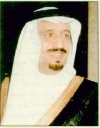
○ الأمير سلمان بن عبدالعزيز ○ مشيراً إلى أن الموقع يتضمن معلومات عن جمعية الأطفال المعاقين ومراكزها المختلفة ومركز الأمير سلمان لإبحاث الإعاقة، بالإضافة إلى معلومات عن المؤتمر السعودي الأول لجمعية الأطفال المعاقين، مؤكداً أن حضور المؤتمر مجاني للراغبين والمهتمين وكذلك العاقين وأسراهم.

○ الرياض - الجزيرة: يرعى صاحب السمو الملكي الأمير سلمان بن عبدالعزيز أمير منطقة الرياض المؤتمر الدولي الثاني للإعاقة والتأهيل وذلك خلال الفترة من 26 إلى 29 رجب ١421هـ الموافق 23 - 26 أكتوبر 2000م بقاعة الملك فيصل للمؤتمرات بغندق الانتراكي منتننل بالرياض. وأوضح المشرف العام على مركز الأمير سلمان لإبحاث الإعاقة وأمين عام المؤتمر الدكتور محسن الحازمي، أنه تم استحداث موقع على شبكة الإنترنت تمت عنون: WWW.Psodr.org.sa وقال إن هذا الموقع يحتوي على معلومات شاملة عن المؤتمر تتضمن محاور المؤتمر ومجال اهتمامه، ويضم نماذج خاصة لتقديم ملخصات البحوث كذلك نماذج خاصة تحتوي على المعلومات المطلوبة للحصول على تأشيرة الدخول للمحاضرين المقبولين أوراقيم العلمية للمشاركة ضمن فعاليات المؤتمر. من خارج المملكة، وكذلك نموذج حجز الفنادق.