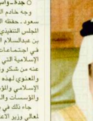
○ خادم الحرمين الشريفين ○ وقال حفظه الله، لا يسعنا إزاء ذلك إلا أن نعبر لكم ولكل الاخوة المشاركين عن بالغ امتناننا وأسمى تقديرنا على ما أبدوه من مشاعر صادقة وأمنيات طيبة وتهمين لمواقف وأدوار المملكة العربية السعودية حيال اخوانهم المسلمين من خلال المنظمات والهيئات الإسلامية.

○ جدة - واس: وجه خادم الحرمين الشريفين الملك فهد بن عبدالعزيز آل سعود - حفظه الله - شكره وتقديره لمعالي وزير الإعلام رئيس المجلس التنفيذي لمنظمة الإذاعات الإسلامية الدكتور فؤاد بن عبدالسلام الغازي وممثلي الدول الإسلامية المشاركين في اجتماعات المجلس التنفيذي لمنظمة الإذاعات الإسلامية التي انتهت أعمالها في جدة مؤخراً على ما عبروا عنه من شكر وتقدير للمملكة على رعايتها ودعمها المادي والعنوي لهذه المنظمة والمساعدات المتعددة لمنظمة المؤتمر الإسلامي والمؤسسات والراكز المتفرعة عنها وللمراكز والمؤسسات والجمعيات الإسلامية في أرجاء العالم جاء ذلك في برفقة جوابية وجهها خادم الحرمين الشريفين لمعالي وزير الإعلام ودأ على البرقية التي رفعها معاليه للملك الفدي التي ضمنها الشكر والتقدير للمملكة من مطلي الدول الإسلامية المشاركين في الاجتماعات.