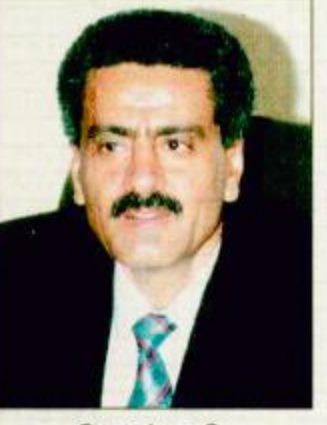
○ حسين عرب ○ مشيراً إلى أن اختيار الشركة التي ستنفذ مشروع العلامات الحدودية سيتم خلال الاجتماع القادم للجنة.

○ صنعاء - الجزيرة - عبدالمنعم الجابري: أكد وزير الداخلية اليمني اللواء الركن د. حسين محمد عرب أن أعمال لجنة تنفيذ معاهدة الحدود الدولية بين المملكة واليمن تسير بصورة ممتازة، مشيراً إلى أن هناك خطوات مهمة قطعتها اللجنة فيما يتعلق بتنفيذ المهام الموكلة لها وفقاً لما تضمنته المعاهدة. وأعلن أن اللجنة الفنية أقرت مشروع المواصفات الخاصة بالعلامات الحدودية، وسوف تجتمع في العاشر من الشهر القادم لدراسة العروض المقدمة من عدد من الشركات لتنفيذ مشروع العلامات (السيارات) على طول خط الحدود ورفع تصورات حول ذلك إلى لجنة تنفيذ المعاهدة التي ستعقد اجتماعات جولتها الثالثة منتصف أكتوبر القادم في المملكة برئاسة وزير الداخلية في البلدين..