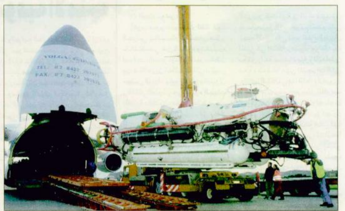
○ ترونهيم - النرويج - رويترز: غواصة الإنقاذ البريطانية LRS5، تنقل من ميناء الشحن في روسيا في طريقها لمساعدة الغواصة الروسية.

○ موسكو - واشنطن - الوكالات: دخلت عمليات إنقاذ طاقم الغواصة الروسية «كورسك» مساء أمس، طوراً جديداً أكثر مردوداً حسب قول المسؤولين الروس. أعلن ذلك ناطق باسم هيئة الأركان العامة للقوات البحرية الروسية في تصريح نقلته وكالة انباء ايتار تاس.. وأكد أن ذلك يرجع في المقام الأول إلى تحسن ظروف الطقس في منطقة الحادث. وأشار إلى أنه تجري في الوقت الحاضر عملية أخرى لتجسيب جرافة الانقاذ التي ستواصل فحص هيكل الغواصة. ويسود في هيئة الأركان العامة الاعتقاد بأن الأعمال المتعلقة بانقاذ طاقم الغواصة ستجري بصورة أكثر فاعلية بوصول سفيتني انقاذ ترويجيتين على متنها جهاز انقاذ بريطاني وغواصون ترويجيون إلى منطقة الحادث.. وستصل هاتان السفينتان افتراضياً إلى منطقة الكارثة يومي السبت أو الأحد القادمين. من جانبه صرح مسؤول روسي كبير أن الاحتمالات المتعلقة بأسباب وقوع حادثة الغواصة الروسية تبرز في المقام الأول بفرضية اصطدامها بجسم صناعي مجهول مؤكداً أن تلك الفرضية مدعومة بنجح دامغة. وأشار ليعور سرجيف وزير الدفاع الروسي خلال مؤتمر صحفي عقد هنا أمس إلى أنه سيبدأ كل ما يجب بلذه من أجل انقاذ بحارة الغواصة مؤكداً أنه رغم الحادث أن الغواصة لن تستعيد من أسلحة الاسطول البحري الروسي. وفي غضون ذلك تستمر في مكان الحادث أعمال الانقاذ وتحاول شبكة اجهزة خاصة الانحنام بالباب الاحتياطي للغواصة. وقال ناطق أخرى صرح رئيس للكتب الصحفي للقوات البحرية الروسية أن بلاده تلك احداث الوسائل لانقاذ طاقم الغواصة.. إلا أنها سوف تقبل أي مساعدة خارجية.