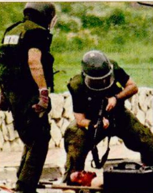
أم الفحم شرطي إسرائيلي يصبو بذقيته نحو فلسطيني جريح من المعتقد أنه كان يحمل متفجرات