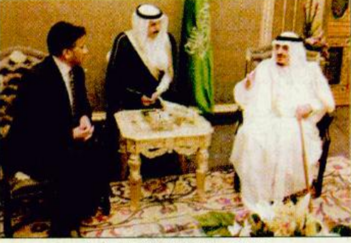
خادم الحرمين لدى استقباله للجنرال مشرف الجنرال برويز مشرف مستشار الرئيس التنفيذي لجمهورية باكستان الإسلامية والوفد المرافق له. وقد عقد خادم الحرمين الشريفين الملك فهد بن عبدالعزيز آل سعود في مكتبه بقصر السلام بجدة أمس دولة