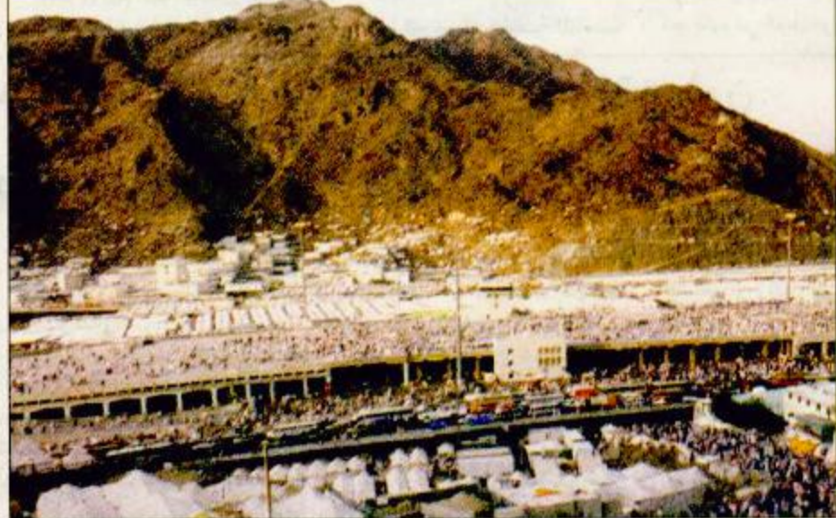
استمكلت الخدمات في منى من خيام مكيفة وتوفر المواد الغذائية في انتظار ضيوف الرحمن

بعث خادم الحرمين الشريفين الملك فهد بن عبدالعزيز آل سعود برقية تهنئة إلى فخامة الرئيس بيتر ستويا نوف رئيس جمهورية بلغاريا بمناسبة ذكرى اليوم الوطني لبلاده. وقد أعرب خادم الحرمين الشريفين باسمه وباسم شعب وحكومة المملكة العربية السعودية عن أطيب التهاني وأخلص التمنيات بالصحة والسعادة لفخامته والتقدم والأزدهار لشعب بلغاريا الصديق.