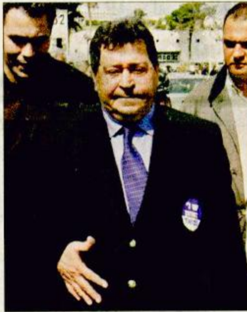
تل أبيب «أ» ف ب بنيامين بن اليعازر «ف» عامه يغادر اجتماع حزب العمل الإسرائيلي بعد اختياره وزيرا للدفاع

أعلن مسؤول رفيع المستوى في حزب العمل لوكالة فرانس برس أن اللجنة المركزية للحزب انتخبت صباح أمس الجمعة بنيامين بن اليعازر الذي يمثل جناح الصقور في الحزب وزيرا للدفاع في حكومة الوحدة الوطنية المقبلة برئاسة ارييل شارون. وقال بن اليعازر المعروف بأنه رجل حازم وشديد الصراحة ردا على أسئلة الإذاعة الإسرائيلية أثناء عملية التصويت أن سياسته (ستكون أفهام الفلسطينيين بأن من مصلحةهم التفاوض وليس اللجوء إلى العنف). وتعتبر حقيبة الدفاع واحدة من ثماني حقائب تستند إلى حزب العمل في حكومة زعيم الليكود اليميني شارون.