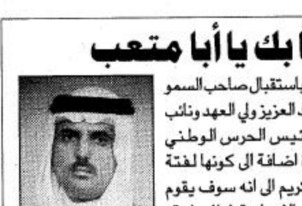
مبارك بن عبد العزيز الرامل

تشرف المنطقة الشرقية باستقبال صاحب السمو الملكي الامير عبد الله بن عبدالعزيز ولي العهد ونائب رئيس مجلس الوزراء ورئيس الحرس الوطني وتبنيه لعمية هذه الزيارة اضافة الى كونها لفنة ابوية حالية من سموه الكريم الى انه سوف يقوم بافتتاح عدد من المشاريع الانمائية في المنطقة، لتضاهي لبنة جديدة على هذا البناء الشامخ الذي اسسه المغفور له الملك عبد العزيز آل سعود، وراهه ابناءه البررة... ولتؤكد استمرارية مسيرة الخير والنماء... في ظل قيادة مولانا خادم الحرمين الشريفين... اننا وبكل قلوبنا نقول، مرحباً بك يا ابا متعب بين ابناءك.