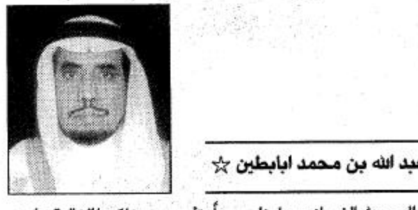
عبد الله بن محمد ابابطين

الحمد لله الذي انعم علينا جميعاً بتأسيس مملكتنا الغالية على يد الملك عبد العزيز بن عبد الرحمن الفيصل طيب الله ثراه الذي ورث من بعده ابناءه بررة ساروا على نهجه متقائين في خدمة دينهم ووطنهم ومحققين لمبدأ التلاحم والوحدة بينهم وبين افراد شعبهم دائبين على انجاز كل ما من شأنه تحقيق امن واستقرار ورفقي ورفاهية مجتمعهم ولا شك ان زيارة سيدي صاحب السمو الملكي الامير عبد الله بن عبد العزيز ولي العهد نائب رئيس مجلس الوزراء ورئيس الحرس الوطني (حفظه الله) الى المنطقة الشرقية وما تحمله من مضامين خيرة وبنائة تأتي تجسيدا لمبدأ التلاحم والوحدة بين القيادة والشعب تأكيداً لحقيقة مسيرة النماء والتقدم التي تشهدها المملكة في مختلف المجالات منذ عهد الملك عبد العزيز وابنته سعود وفضل وخالد رحمهم الله وحتى زماننا الحاضر عهد مولاي خادم الحرمين الشريفين الملك فهد بن عبد العزيز حفظه الله الذي تحققت خلاله النهضة الشاملة لمملكتنا والتي لا زلنا نلمس اثرها من خلال المشاريع المنجزة والجاري تنفيذها في شتى المجالات والذائرة عجلتها على مر السنين بمشيئة الله تعالى. فهناك العديد من المشاريع العملاقة في المنطقة التي سوف يتم افتتاحها او وضع حجر اساسها على يد صاحب السمو الملكي ولي العهد الامين والتي سوف يجني ثمارها ونتائجها جميع المواطنين والقيمين في المنطقة الشرقية والتي يعكس حجم اهتمامات حكومتنا الرشيدة بالوطن والمواطنين والتي لا نملك اذاعها سوى التضرع الى الله عز وجل ان يديم نعمته علينا جميعاً وان يحفظ مولاي خادم الحرمين الشريفين وسمو ولي عهده الامين ويسدد على طريق الخير خطاهم.