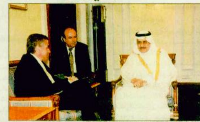
الأمير نايف لدى استقباله وزير خارجية رومانيا

جدة-الغاط-فهد الفهد-واس: يقوم صاحب السمو الملكي الأمير نايف بن عبدالعزيز وزير الداخلية اليوم بزيارته لحافظة الغاط وذلك لرعاية حفل جائزة معالي الأمير خالد بن أحمد السديري للفتوى العلمي لطبية وطبائيات محافظات الغاط والمجمعة والزلفي ومن المتوقع ان يصل سموه الكريم إلى