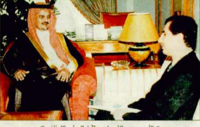
الأمير سعود الفيصل يستقبل السفير اللبناني

جدة-واس: استقبل صاحب السمو الملكي الأمير سعود الفيصل وزير الخارجية في قصر الؤتمات بجدة أمس سفير جمهورية نيجيريا المعين لدى المملكة محمد حاجيبي الذي قدم لسموه صورة من أوراق اعتماده سفيراً أيلاده بالبقية ص ٢٨