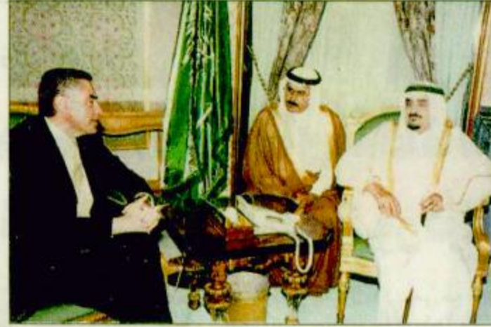
خدام الحرمين الشريفين لدى استقباله وزير خارجية رومانيا

جدة-واس: تسلم خادم الحرمين الشريفين الملك فهد بن عبدالعزيز آل سعود رسالة من فخامة الرئيس اميل كونستا نيتيسكو رئيس جمهورية رومانيا. وقام بتسليم الرسالة لخدام الحرمين الشريفين معالي نائب رئيس الوزراء ووزير خارجية رومانيا بتري رومان خلال استقبال الملك الفهد له في مكتبه بقصر السلام أمس. وحضر الاستقبال صاحب السمو الملكي الأمير سعود الفيصل وزير الخارجية وصاحب السمو الملكي الأمير عبدالعزيز بن فهد بن عبدالعزيز وزير