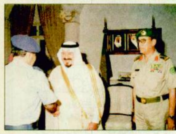
الأمر سلطان لدى استقباله قادة فروع القوات المسلحة

الرياض-واس: استقبل صاحب السمو الملكي الأمير سلطان بن عبدالعزيز النائب الثاني لرئيس مجلس الوزراء وزير الدفاع والطيران والمفتش العام بمكتب سموه بالمعز مس عالي رئيس هيئة الأركان العامة الفريق أول ركن صالح بن علي المحيا وقادة فروع القوات المسلحة البرية والجوية والبحرية والدفاع الجوي ورؤساء الهيئات ومندوبي الإدارات وكبار