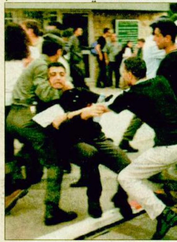
مقتل أحد عناصر ميليشيا الجنوبى

بيروت-الوكالات: دعا رئيس الحكومة اللبنانية سليم الحص الولايات المتحدة أمس الأربعاء للحفاظ على دورها في رعاية عملية السلام في الشرق الأوسط وعدم الاكتفاء بالانسحاب الإسرائيلي للزعم من جنوب لبنان في يوليو تموز لمثل. وقال الحص في تصريح نشر أمس، توحي الموقف الإسرائيلي بأن إسرائيل ترى في الانسحاب الأحادي من لبنان بديلاً عن خيار التسوية الشاملة مع لبنان وسوريا وهي تسعى إلى جر الولايات المتحدة الأمريكية إلى موقف مماثل.