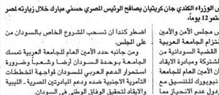
القاهرة - مصر «ويتزر» رئيس الوزراء الكندي جان كريتيان يصافح الرئيس المصري حسني مبارك خلال زيارته لمصر والشرق الأوسط والتي سوف تستمر 12 يوما.

باعت جامعة الدول العربية نجاح جهودها بالتنسيق مع منظمة الوحدة الأفريقية ومنظمة المؤتمر الإسلامي في إقناع كندا الرئيسي الحالي لمجلس الأمن في العدول عن موقفها السابق والتي تضمنتها طرح المسألة السودانية على مجلس الأمن الدولي.