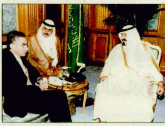
سمو ولي العهد لدى استقباله وزير خارجية رومانيا

جدة-واس: تسلم صاحب السمو الملكي الأمير عبدالله بن عبدالعزيز ولي العهد ونائب رئيس مجلس الوزراء ورئيس الحرس الوطني رسالة من فخامة الرئيس اميل كونستا نيتيسكو رئيس جمهورية رومانيا. وقام بتسليم الرسالة لسمو ولي العهد معالي نائب رئيس الوزراء ووزير خارجية رومانيا بتري رومان خلال استقبال سموه له في مكتبه بالديوان