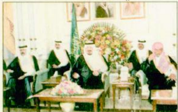
○ الأمير سلطان يقيم حفل العشاء لاهالي الأحساء - واس ○ صالح بن علي بن عبدالعزيز عن جميع قبائل وشيوخ صحراء سيناء قال فيها: هناك مثل في صحراء سيناء يقول: لا تقذف الحجارة إلا بالبقية ص ٣٣

○ الرياض - الجزيرة - الأحساء - واس: شجبت جميع قبائل وشيوخ صحراء سيناء الحملة الإعلامية الجائرة على المملكة مما تسمى لجان حقوق الإنسان الدولية. كما استنكرت اتهامات تلك اللجان للمملكة. ووصفت القبائل وشيوخها ذلك بأنها اتهامات كاذبة ومزيفة دافعاها الحق على المملكة التي أصبحت مضرب الأمثال في التطور والتقدم والعدالة الإنسانية بين جميع مواطنيها ولقيمين بها في سائر الحقوق التي كفلتها مبادئ الشريعة الإسلامية السمحة التي تطبقها المملكة نضاً وروحاً. جاء ذلك في رسالة تلقاها