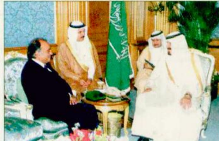
○ سمو ولي العهد لدى استقباله سفير باكستان ○ ○ الرياض - جدة - واس: استقبل صاحب السمو الملكي الأمير عبدالله بن عبدالعزيز ولي العهد ونائب رئيس مجلس الوزراء ورئيس الحرس الوطني في مكتب سموه بالديوان الملكي في قصر السلام أمس سفير جمهورية جنوب إفريقيا لدى المملكة صمويل البقية ص ٣٣