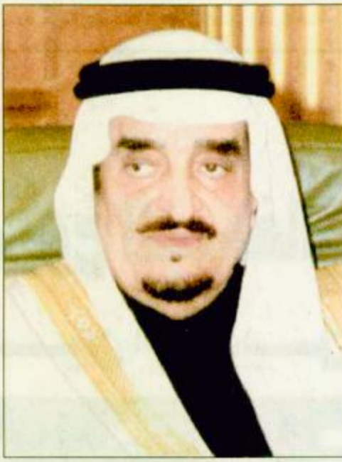
○ خادم الحرمين الشريفين

○ جدة - واس: بعث خادم الحرمين الشريفين الملك فهد بن عبدالعزيز آل سعود برفيقة تهنئة إلى فخامة الرئيس ليونيد كوتشما ورئيس جمهورية أوكرانيا بمناسبة ذكرى اليوم الوطني لبلادها. وقد أعرب الملك المفدى باسمه وباسم شعب وحكومة المملكة العربية السعودية عن أطيب التهاني مقرونة بتعظيمات الشعب والسعادة لفخامة الرئيس كوتشما والتقدم المطرد لشعب أوكرانيا الصديق