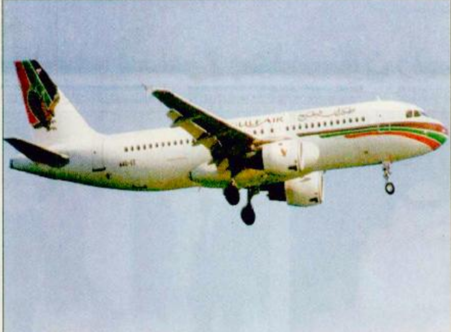
○ صورة أرشيفية للطائرة المكتوبة ○