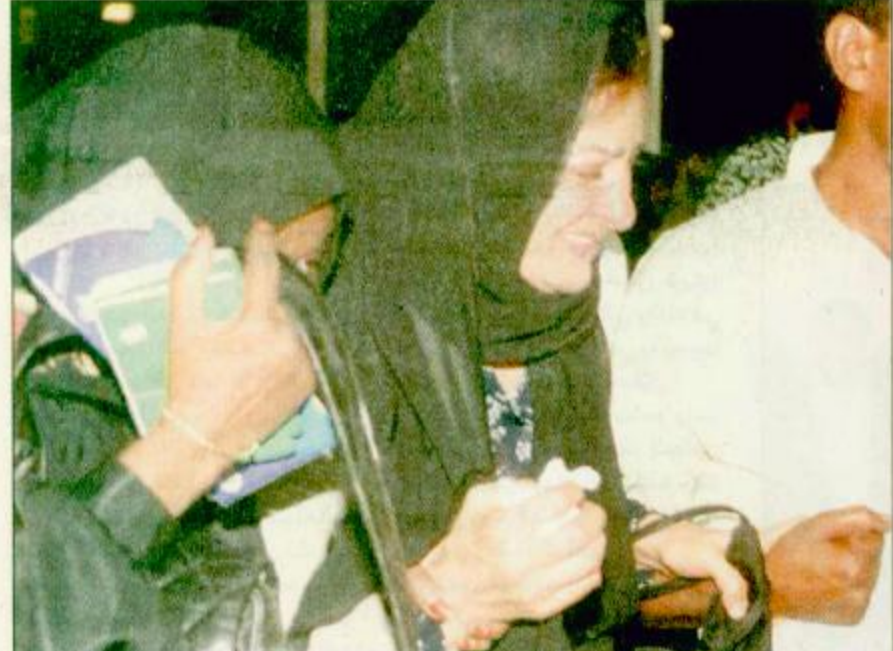
○ امرأتان تفتيان قاربهما من ركاب الطائرة ○