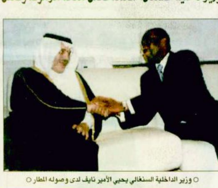
○ وزير الداخلية السنغالي يحيي الأمير نايف لدى وصوله المطار ○

○ داكار - واس - الجزيرة: أعرب صاحب السمو الملكي الأمير نايف بن عبدالعزيز وزير الداخلية الذي وصل إلى داكار مساء أول أمس في مستهل زيارة رسمية لجمهورية السنغال، أعرب عن سعاده بهذه الزيارة وقال فور وصول سموه مساء أمس الأول أنه يزور السنغال بدعوة كريمة من فخامة الرئيس عبدالله واد حاملاً معه تحيات واحترام وتقدير خادم الحرمين الشريفين وسمو ولي عهده الأمين إلى فخامة الرئيس والشعب السنغالي. وأكد سموه على متانة العلاقة التي تربط المملكة العربية السعودية