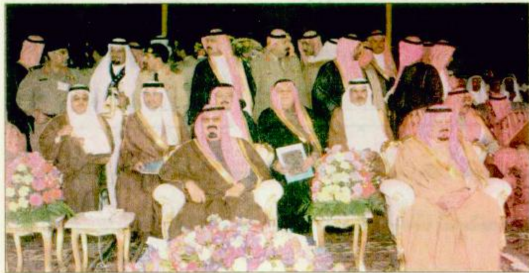
سمو ولي العهد رعى وضع حجر الأساس للمدينة الجامعية

طرق جديدة هدية سمو ولي العهد لمنطقة عسير اليوم الثالث.. لزيارة سموه: عروض عسكرية لأفرع القوات المسلحة وافتتاح منشآت ومرافق عسكرية جديدة وافتتاح المحطة الكهربائية