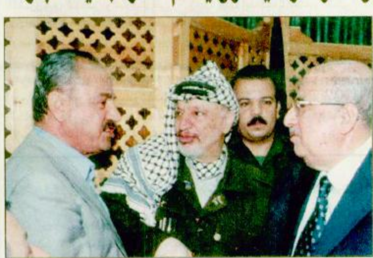
غزة - أ. ف. ب. ياسر عرفات يتجس في مصالحة أبو عبي مصطفى أمين عام الجبهة الشعبية لتحرير فلسطين وسفير الزعوت رئيس المجلس الوطني الفلسطيني بعد مشادة حصلت بينهما.