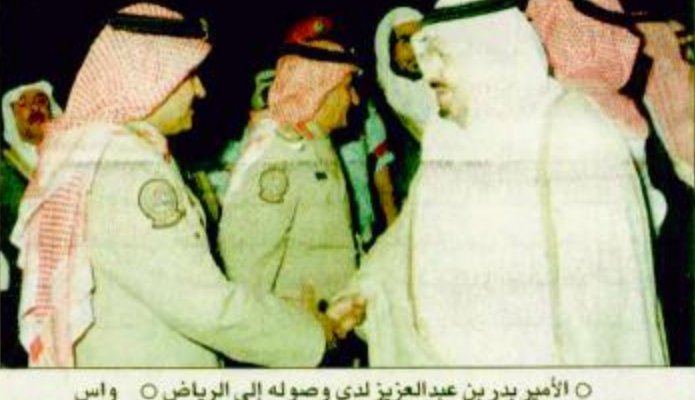
الأمير بدر بن عبدالعزيز لدى وصوله إلى الرياض - واس

الرياض - واس: وصل إلى الرياض مساء أمس صاحب السمو الملكي الأمير بدر بن عبدالعزيز نائب رئيس الحرس الوطني قادماً من محافظة جدة. وكان في استقبال سموه بمطار القاعدة الجوية صاحب السمو الملكي الأمير فهد بن بدر بن عبدالعزيز نائب أمير منطقة الجوف وصاحب السمو البقية ص ٣٣