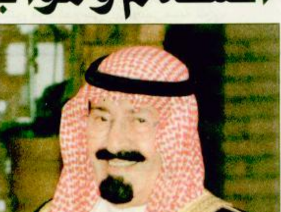
سمو ولي العهد

بتأكيد العمل على التصدي للحروب والفقر والممرض، والتصدي للفوارق بين الشمال والجنوب وتوزيع أفضل لعوائد العولمة اختتمت بمقر الأمم المتحدة في نيويورك فجر أمس السبت بتوقيع الملكة مساء يوم الجمعة بتوقيع نيويورك قمة الألفية الثالثة التي شارك فيها 156 رئيس دولة وممثلون عنهم. ونهاية عن خادم الحرمين الشريفين الملك فهد بن عبدالعزيز آل سعود شارك صاحب السمو الملكي الأمير عبدالله بن عبدالعزيز ولي العهد ونائب رئيس مجلس الوزراء ورئيس الحرس الوطني في قمة الألفية للأمم المتحدة. والقي سموه كلمة المملكة العربية السعودية في الجلسة الافتتاحية يوم الأربعاء الماضي حيث تضمنت رؤية المملكة لدور منظمة الأمم المتحدة وما يواجهها ويواجه دول العالم من تحديات سياسية وأمنية واقتصادية واجتماعية تؤكد مدى الحاجة الى اصطلاح المنظمة بدورها في الحفاظ على الأمن والسلام في العالم وتحقيق الرخاء والازدهار لشعوبه. كما التقى صاحب السمو الملكي الأمير عبدالله بن عبدالعزيز على هامش القمة بالعديد من زعماء العالم ورؤساء البقية ص ٣٣