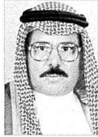
عبد الرحمن السبيتي

حضر وكيل الحرس الوطني ورئيس اللجنة التنفيذية لمهرجان الجنادرية الدكتور عبدالرحمن بن سبيته السبيتي فعاليات اختتام أنشطة المعاقين في صالة مركز التاهيل المهني للمعاقين التابع لوزارة العمل والشؤون الاجتماعية وذلك عصر الخميس الماضي بمقر القرية الشعبية بالجنادرية. وقد نظمت فعاليات المسابقات الرياضية للمعاقين قرب الخيمة الاجتماعية المعدة لهذا الغرض. وشملت المسابقات الرياضية عدداً كبيراً من الألعاب منها لعبة سباق الكراسي المتحركة للأطفال المتوولين وسباق الموانع ورمي الرمح وكرة السرعة وسباق المسابقات للمعاقين ومباراة كرة سلة. وقد بدأ الحفل بالقرآن الكريم