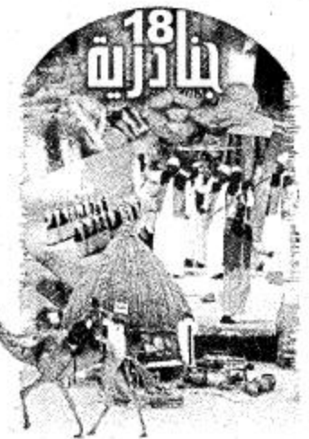
الجزيرة - وسيلة الحلبي

تحتفي قرية الجنادرية التراثية بالرياض مقر المهرجان الوطني للتراث والثقافة غداً الإثنين بتشريف صاحب السمو الملكي الأميرة نواف بنت عبدالعزيز راعية الفعاليات النسائية الثقافية والتراثية للمهرجان حيث برعايتها تبدأ زيارات ضيفات المهرجان ثم الزيارات النسائية عامة ابتداء من يوم الثلاثاء.