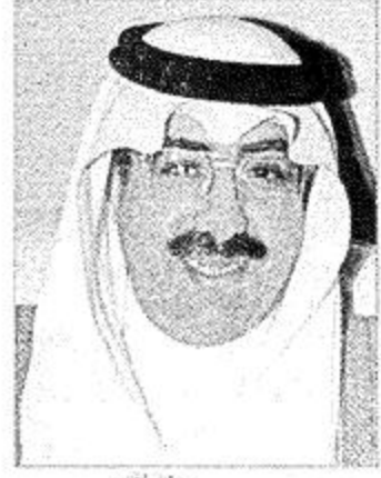
الأمير فيصل بن عبدالله

قام صاحب السمو الأمير فيصل بن عبدالله بن محمد وكيل الحرس الوطني بالقطاع الغربي بزيارة إلى المعارض المحاصصة للنشاط الثقافي للمهرجان الوطني الثامن عشر للتراث والثقافة وذلك على قاعة الملك فيصل للمؤتمرات بالرياض. وقد بدأ سموه الزيارة بجولة في معرض الإعجاز العلمي في القرآن الذي ينظمه جهاز الإرشاد والتوجيه بالحرس الوطني حيث استمع سموه إلى شرح عن محتويات المعرض وما يضمه من صور وعروض ومجسمات كما زار سموه المعرض الخاص بالإستاد صالح العزاز رحمة الله والذي يحتوي على العديد من الصور الفوتوغرافية التي تعبر عن البيئة الصحراوية. وقد أعرب سموه عن سعادته وسروره بما شاهدته خلال الزيارة ونوه بأهمية النشاطات التي يحضنها المهرجان بكافة الفعاليات المتنوعة وأشار سموه إلى أن هذه النشاطات تعود بالنفع والفائدة على الجميع وشكر سموه القائمين على المهرجان وتمنى للجميع التوفيق.