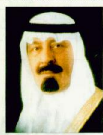
نائب خادم الحرمين يتلقى اتصالاً من شافيز جدة - واس:

ازدادت المخاوف من تطور النزاع بين الهند وباكستان الى حرب نووية، ولكن المعلومات المتوفرة حتى الآن تقول ان الهند تعزز من غارات جوية على الجزء من كشمير الواقع تحت السيطرة الباكستانية مع احتمال ان يدعم ذلك هجوم بري محدود. ونسبت التقارير الى مسؤولين امين قولهم ان المدفعية الهندية أطلقت أكثر من ١٦,٠٠٠ قذيفة خلال الأيام السبعة الماضية على شريط عرضه كيلين عبر خط المراقبة عند كشمير. وتبادلت الدولتان القصف المدفعي العنيف امس وقد احترقت من جراء ذلك العديد من القرى الحدودية. وصدرت تعليمات هندية بإجلاء قرى أخرى. وقال مسؤولون باكستانيون ان بلادهم قد تضطر مع استمرار النزاع الى سحب قواتها الموجودة على حدودها مع أفغانستان وتدفع بها الى المواجهة مع الهند وقالوا ان اسلام اباد بلغت شركاء التحالف ضد الارهاب بهذه الخطط. وحسب جاك ستورو وزير الخارجية البريطاني امس الخميس من خطر حقيقي لاندلاع حرب نووية بين الهند وباكستان مع تصاعد التوتر بين البلدين بسبب كشمير. وحث سترو قبل زيارته للمنطقة الاسبوع القادم المجتمع الدولي على بذل قصارى جهده مع البلدين «للابتعاد عن شفاء الهواة، الا انه اعترف بان ثمة حدودا لما يمكنه ان يقوم به لتسوية النزاع الناشب منذ ما يزيد على ٥٠ عاما. وناشدت الولايات المتحدة الأمريكية البلدين مجددا بدء حوار حول كشمير بدلا من العنود في حرب..... طالع ص ١٧