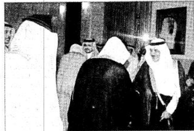
لقطات من الاستقبال