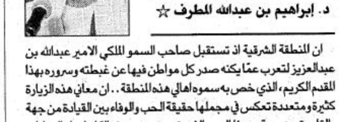
ابراهيم بن عبدالله المرط

ان المنطقة الشرقية ان تستقبل صاحب السمو الملكي الامير عبدالله بن عبدالعزيز لتعرب عمّا يكنه صدر كل مواطن فيها عن غبطته وسروره بهذا المقدم الكريم، الذي خص به سموه اهالي هذه المنطقة... ان معاني هذه الزيارة كثيرة ومتعددة تعكس في مجملها حقيقة الحب والوفاء بين القيادة من جهة والقاعدة من جهة... هذا الذي تعجز عن وصفه الكلمات او العبارات التي تتضال امام تلك العلاقة الحميمة التي تعتمد في اساسها على وشلخ الدين والعقيدة والشرع القوس... وذلك الوفاء الذي لا تحده حدود، ولا تقف امامه سدود، انه الوفاء الذي زرع بذرة المغفور له الملك عبدالعزيز بورود اللوة وحب الوطن.