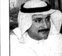
سعد بن عبدالرحمن اللقن

تشهد المملكة العربية السعودية عصر نماء وازدهار حتى في ظل احلك الظروف الاقتصادية على المستوى العالمي والنتائج الكثير من الزيارات اليمونة لقيادتنا الحكيمية لمختلف مناطق المملكة لياحظ باهتمام ويفخر المشاريع تلو المشاريع التي تقدمها في سبيل رفاهية المواطن وراحتة واستقراره.