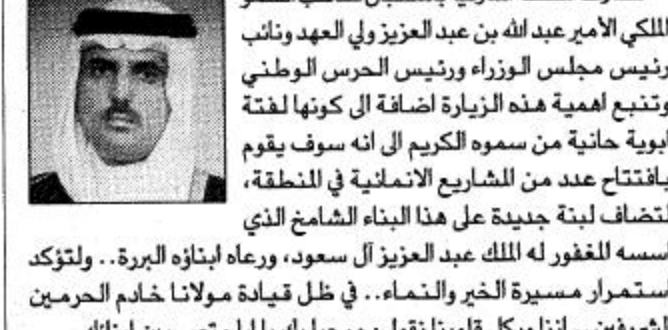
سليمان بن عبد الرحمن السحيمي

تشرف المنطقة الشرقية باستقبال صاحب السمو الملكي الامير عبد الله بن عبدالعزيز ولي العهد ونائب رئيس مجلس الوزراء ورئيس الحرس الوطني وتبنيه اعمية هذه الزيارة اضافة الى كونها لفته ابوية حانية من سموه الكريم الى انه سوف يقوم بافتتاح عدد من المشاريع الانمائية في المنطقة، لتضاف لبنة جديدة على هذا البناء الشامخ الذي اسسه المغفور له الملك عبد العزيز آل سعود، وراه ابناءه البررة... ولتؤكد استمرارية مسيرة الخير والتنمية... في ظل قيادة مولانا خادم الحرمين الشريفين... اننا وبكل قلوبنا نقول، مرحباً بك يا ابا متعب بين ابناءك.