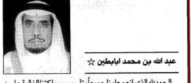
عبد الله بن محمد ابابطين

الحمد لله الذي انعم علينا جميعاً بتأسيس مملكتنا الغالية على يد الملك عبد العزيز بن عبد الرحمن الفيصل طيب الله ثراه الذي ورث من بعده ابناءه بررة ساروا على نهجه متقائين في خدمة دينهم ووطنهم ومحققين لمبدأ التلاحم والوحدة بينهم وبين افراد شعبهم دائبين على انجاز كل ما من شأنه تحقيق امن واستقرار ورفقي ورفاهية مجتمعهم ولا شك ان زيارة سيدي صاحب السمو الملكي الامير عبد الله بن عبد العزيز ولي العهد نائب رئيس مجلس الوزراء ورئيس الحرس الوطني (حفظه الله) الى المنطقة الشرقية وما تحمله من مضامين خيرة وبنائة تأتي تجسيدا لمبدأ التلاحم والوحدة بين القيادة والشعب تأكيداً لحقيقة مسيرة النماء والتقدم التي تشهدها المملكة في مختلف المجالات منذ عهد الملك عبد العزيز وابنته سعود وافيصل وخالد رحمهم الله وحتى زماننا الحاضر عهد مولاي خادم الحرمين الشريفين الملك فهد بن عبد العزيز حفظه الله الذي تحققت خلاله النهضة الشاملة لمملكتنا والتي لا زلنا نلمس اثرها من خلال المشاريع المنجزة والجاري تنفيذها في شتى المجالات والذائرة جعلتها على مر السنين مبشئة الله تعالى... فهناك العديد من المشاريع العملاقة في المنطقة التي سوف يتم افتتاحها ووضع حجر اساسها على يد صاحب السمو الملكي ولي العهد الامين والتي سوف يجني ثمارها ونتائجها جميع المواطنين والقيمين في المنطقة الشرقية والتي يعكس حجم اهتمامات حكومتنا الرشيدة بالوطن والمواطنين والتي لا نملك اذاعها سوى التضرع الى الله عز وجل ان يديم نعمته علينا جميعاً وان يحفظ مولاي خادم الحرمين الشريفين وسمو ولي عهده الامين ويسدد على طريق الخير خطاهم.