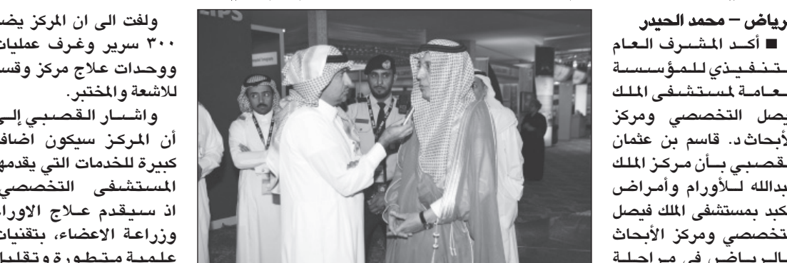
الرياض - محمد الحيدر أكد المشرف العام التنفيذي للمؤسسة العامة لمستشفى الملك فيصل التخصصي ومركز الأبحاث د. قاسم بن عثمان القصبي بأن مركز الملك عبدالله للأورام وأمراض الكبد بمستشفى الملك فيصل التخصصي ومركز الأبحاث بالرياض في مرحلة الإخيرة، وقال: «سيتم تشغيله ميدانيا خلال الثلاثة أشهر المقبلة». وقال القصبي في تصريح

خاص لـ «الرياض» إن المركز اليوم يمر في مرحلة التجهيز والتأثيث حيث تم توقيع نحو ٤٥ عقدا لذلك، ورصد نحو ٨٠٠ مليون ريال لعمليات التأثيث والتجهيز بالكامل. وأكد القصبي يتحدث للزميل محمد الحيدر