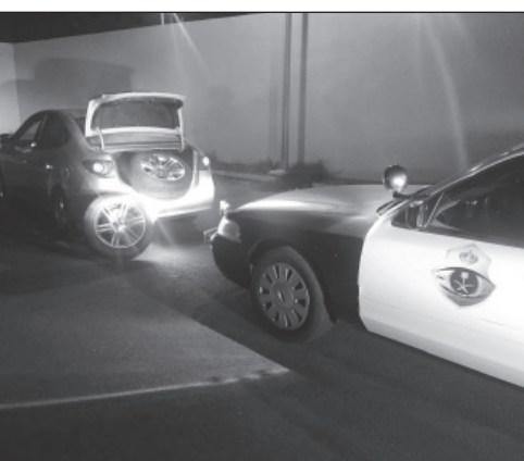
الإطارات المسروقة بعد القبض على العصاة

جازان - علي المدخلي تمكنت دوريات الأمن بمنطقة جازان من إلقاء القبض على عصاة تمتهن سرقة إطارات المركبات. وأوضحت إدارة دوريات الأمن في بيان صحفي، أن عملية الضبط جاءت بالتعاون والتنسيق مع الفرق السرية بعد عمل كمين محكم تم استدراج العصاة من خلاله، وذلك عقب تعرف أحد المواطنين على إطارات مركبته المسروقة عند عرضها للبيع في أحد المواقع الإلكترونية، من قبل أحد أفراد العصاة وعلى الفور قام بتقديم بلاغ رسمي لرجال الأمن، ليتم تشكيل فريق مختص لمتابعة البلاغ والتحري عن الشخص ومتابعته عن طريق الموقع حتى تمكن الفريق من استدراجه والتفاوض معه لشراء الإطارات والجنوط المعروضة في الموقع من قبله. وأضافت في بيانها بأن الفريق قام باستدراجه لأحد الأحياء داخل مدينة جازان وضبطه مباشرة، بالإضافة إلى تعرف المواطن على إطارات مركبته، وأكد البيان أن عملية الضبط جاءت بمتابعة وإشراف ميداني مباشر من قبل مدير إدارة دوريات الأمن بجازان العقيد عيسى آل عمر.