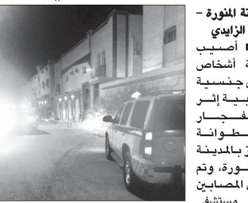
المدينة المنورة - أصيب ثلاثة أشخاص من جنسية عربية إثر انفجار إسطوانة غاز بالمدينة المنورة، وتم نقل المصابين إلى مستشفى الأنصار لتلقي العلاج من حروق صفت في الدرجة الثانية.