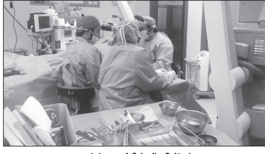
استغرقت العملية خمس ساعات