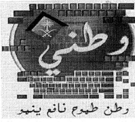
وطن طهر نافع ينمو بالتعاون مع اللجنة الإعلامية لمشروع وطني