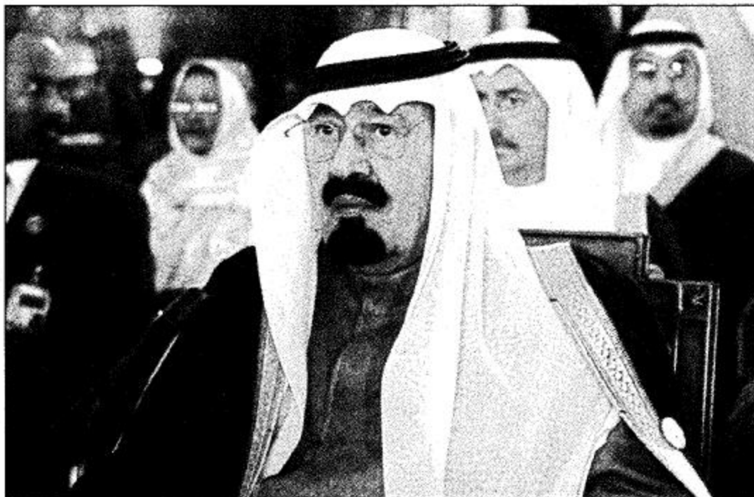
الأمير عبد الله في الجلسة الختامية للقمة