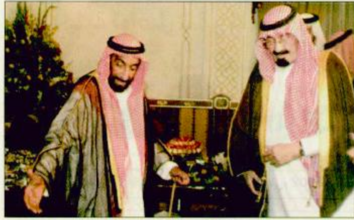
استقبال الشيخ زايد لسمو ولي العهد