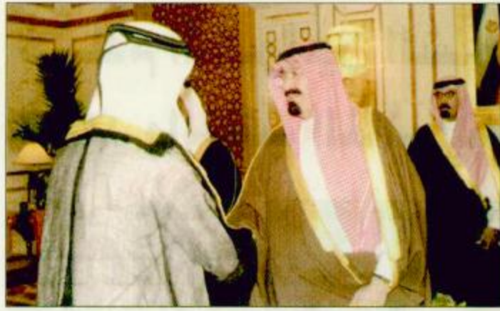
ولي العهد بغادر أبوظبي