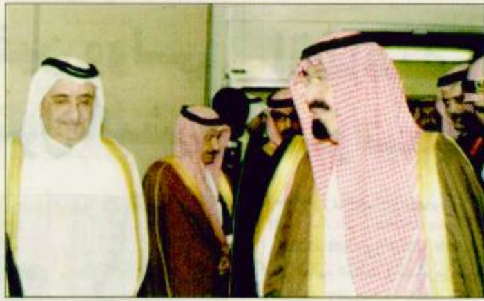
وصول سمو ولي العهد إلى أبوظبي