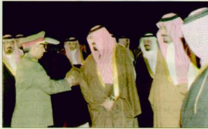
وصول سمو ولي العهد إلى الرياض