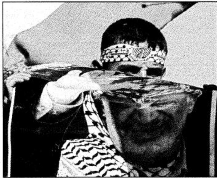
غزة - أ.ف.ب: فلسطيني من انصار حركة فتح يعرض لمصفاً للرئيس الفلسطيني ياسر عرفات خلال تجمع في جامعة الأزهر بمدينة غزة.

بيروت - غزة - واس: دعا الرئيس الفلسطيني ياسر عرفات الأسرة الدولية إلى الاستفادة من الهدنة التي أعلنها في العمليات العسكرية ضد إسرائيل من أجل تحريك المفاوضات. وقال في مقابلة مع شبكة تلفزيون إل بي سي اللبنانية الخاصة أنه يأمل أن تكون هذه الهدنة وسيلة أمام العالم أجمع لحصوله إعادة المفاوضات وجهود السلام. وأضاف أنه يجب إعطاء فرصة لتطبيق مبادئ مدريد وتنفيذ الاتفاقيات المعقودة بين إسرائيل والسلطة الفلسطينية لكنه حذر من أن للصبر حدوداً شديداً إلى أن كل المدن والعقرى الفلسطينية تقريباً محاصرة والشعب يتعب وإسرائيل صادرت 900 مليون دولار من الضرائب والرسوم التي تعود للسلطة الفلسطينية. وتابع قائلاً: «إذا أراد إربيل شارون أن يغير سياسته فأهلاً وسهلاً ولكن إذا صبر أن يستعمل القوة ولا يستمع إلا إلى هدير دبائته وطائراته وصواريخه فنقول له إن التاريخ طويل بينه وبيننا». وأكد عرفات أن الأخوة في حماس وقسماً من الجهاد الإسلامي قبلوا قرار الهدنة الذي اتخذته السلطة في 16 ديسمبر وأعلن أن السلطة ستستمر بالتزامها فرض وقف إطلاق النار بكل حزم. وفيما يتعلق بالمحادثات الجارية بين رئيس المجلس التشريعي الفلسطيني أحمد قريع ووزير الخارجية الإسرائيلي شيمون بيريز اعتبر عرفات أنها لا تزال في مرحلة تبادل الأفكار. وقال: «حتى الآن توجد محادثات وأماناً بعض الأفكار لا أكثر ولا أقل ونحن مستعدون في هذا الاتجاه ولكن المشكلة هي أن شارون يعلن أنه راضٍ أفكار