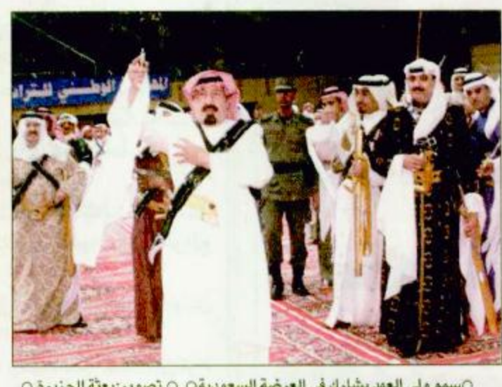
○ سمو ولي العهد يشارك في العرضة السعودية ○ تصوير: بعتة الجزيرة ○

سمو ولي العهد تلقى اتصالاً من الرئيس بوش ○ الرياض-واس: تلقى صاحب السمو الملكي الأمير عبدالله بن عبدالعزيز ولي العهد ونائب رئيس مجلس الوزراء ورئيس الحرس الوطني اتصالاً هاتفياً أمس من فخامة الرئيس جورج دبليو بوش رئيس الولايات المتحدة الأمريكية. وجرى خلال الاتصال بحث العلاقات الثنائية بين البلدين الصديقين واستعراض عدد من الموضوعات ذات الاهتمام المشترك.