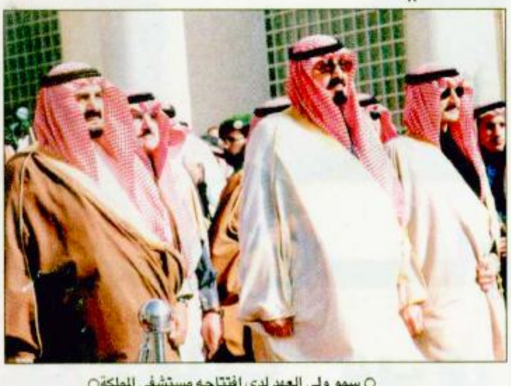
○ سمو ولي العهد لدى افتتاحه مستشفى الملكة البقية، ص ٣٧، تفاصيل من ٣٨-٤٠.

○ الرياض-بعتة الجزيرة-واس: نياية عن خادم الحرمين الشريفين الملك فهد بن عبدالعزيز آل سعود. حفظه الله - رعى صاحب السمو الملكي الأمير عبدالله بن عبدالعزيز ولي العهد نائب رئيس مجلس الوزراء ورئيس الحرس الوطني الرئيس الأعلى للمهرجان الوطني للتراث والثقافة مساء أمس حفل العرضة السعودية الذي أقامه الحرس الوطني ضمن نشاطات المهرجان الوطني السادس عشر للتراث والثقافة وذلك على صالة الألعاب الرياضية المغلقة بطريق الدرعية في الرياض.