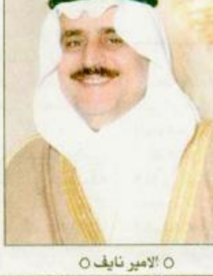
○ الامير نايف

○ الرياض- عوض القحطاني- سعد العبياني: أكد صاحب السمو الملكي الأمير نايف بن عبدالعزيز وزير الداخلية أن السماح للمرأة بقيادة «السيارة» في المملكة غير وارد. وقال سموه في معرض رده على سؤال الجزيرة، حيال ما شهدته الأوساط الإعلامية السعودية من مناقشة موضوع قيادة المرأة للسيارة. قال سموه: يا أخي.. يجب أن يكون ذلك معروفاً. وأن هذا الأمر غير وارد تماماً. وفي الوقت الحاضر المجتمع يرفض هذا الأمر رفضاً واضحاً. فأي كتابة فيه أو مناقشة فهي مناقشة لا جدوى منها ومجرد استعراض لأراء لا قيمة لها. وعلق سمو وزير الداخلية على سؤال الجزيرة، حول المستجدات في التحقيقات في قضايا التفجيرات الأخيرة قائلاً: نترك ذلك لوقت قريب بعشيرة الله ونقول بشيء مفيد. وحول زيارة سموه المرتقبة لإيران أعاد البقية، ص ٣٧.