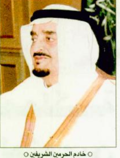
○ خادم الحرمين الشريفين

○ الرياض-واس: تلقى خادم الحرمين الشريفين الملك فهد بن عبدالعزيز آل سعود اتصالاً هاتفياً أمس من فخامة الرئيس جورج دبليو بوش رئيس الولايات المتحدة الأمريكية. وتم خلال الاتصال تبادل الأحاديث الودية وبحث العلاقات الثنائية بين البلدين الصديقين وعدد من الموضوعات ذات الاهتمام المشترك. ومن جهة أخرى وتوجهت من خادم الحرمين الشريفين البقية، ص ٣٧.