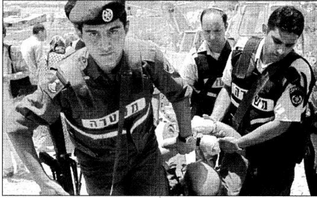
الخليل: افضة قفريية رويترز: يوليس الإسرائيلي يلقى قبض على أحد فلسطينيين المؤيدين للسلام واذين حاولوا منع الجيش الإسرائيلي من طمر الابار وتدمير خزانات المياه الفلسطينية بالخليل.

التفاهل العربية... ودعا إلى تصفية الخلافات العربية كعامل أساسي تعزيزاً للتضامن العربي خاصة في مجال التعاون العربي المشترك لمواجهة التحديات العالمية.