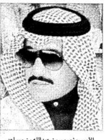
الأمير منصور بن عبدالله بن مساعد

العميد السرحان: موحد هذا الكيان وأبناؤه البررة أروسا دعائم الأمن والاستقرار