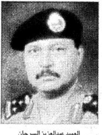
العميد عبدالعزيز السرحان

عبر عدد من المسؤولين بمنطقة الحدود الشمالية عن مشاعر الغبطة والفرح بمناسبة اليوم الوطني المجيد للمملكة، وأكدوا على التضامن بين الراعي والرعية والشعب والقيادة الحكيمة الساهرة على مصالحهم بتوجيهات من خادم الحرمين الشريفين وقيادته الرشيدة المستمدة من النهج القويم الذي سنّه موحد المملكة القائد البطل الملك عبدالعزيز وسار عليه ابتأوه بعده على هدى من الشرع القويم.