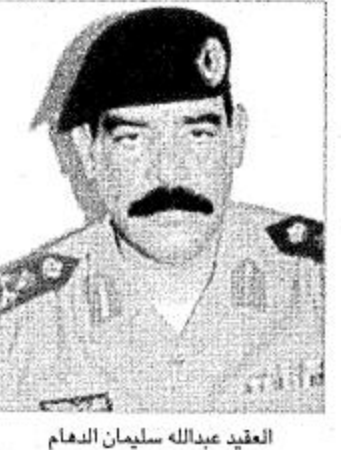
العقيد عبدالله سليمان النعام

أدام الله على بلادنا أمنها وحفظ لها استقرارها وأخر دعوانا أن الحمد لله رب العالمين.