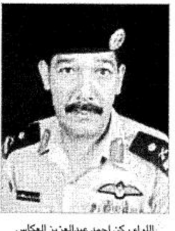
اللواء ركن أحمد عبدالعزيز العكاش