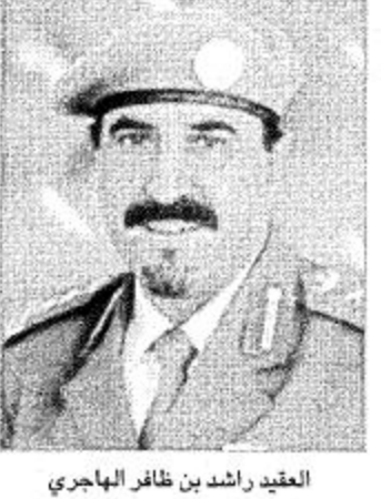
العقيد راشد بن طاهر الهاجري

الأمير منصور: الذكرى تعيد تاريخ وأمجاد الموحد البطل لتستلهمها الأجيال