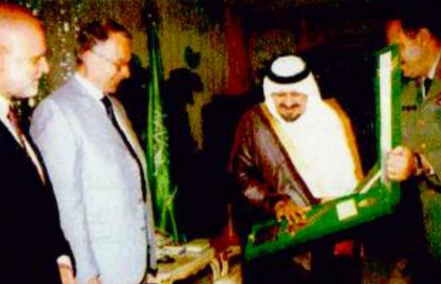
تبادل الهدايا التذكارية

استقبل صاحب السمو الملكي الأمير سلطان بن عبدالعزيز النائب الثاني لرئيس مجلس الوزراء وزير الدفاع والطيران والمفتش العام بمكتب سموه بجدة أمس معالي وزير الزراعة بجمهورية التشيك بان فينسل.