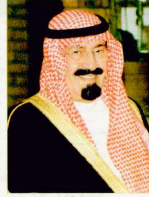
سمو ولي العهد كل المجالات... أضاف معالي رئيس مجلس الشورى يقول «إن المجلس ينتظر التنمية لهذه البلاد المباركة في

وبيّن معاليه أن المنتعج مسيرة الشورى في العهد الزاهر لخادم الحرمين الشريفين والتي شهدت فصلاً من التحديث والتطوير على يده - حفظه الله - يلاحظ مدى الخضوع لهذه المسيرة المباركة فالتكامل شاهد على حرصه - حفظه الله - وسمو ولي عهده الأمين على دعم المجلس مفيداً أن زيادة أعضاء المجلس في دورته الثالثة دليل على ذلك