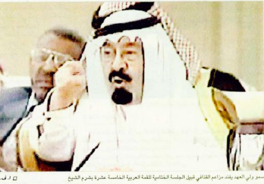
سمو ولي العهد ينادي زملاءه القذافي قبيل الجلسة الختامية للقمة العربية الخامسة عشرة بشرم الشيخ ا. ف. ب