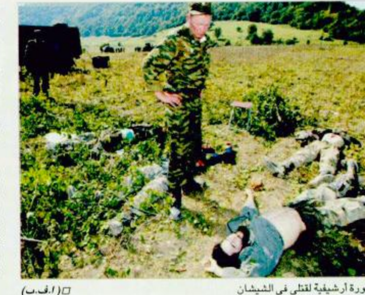
صورة أرشيفية لقنلى في الشيشان