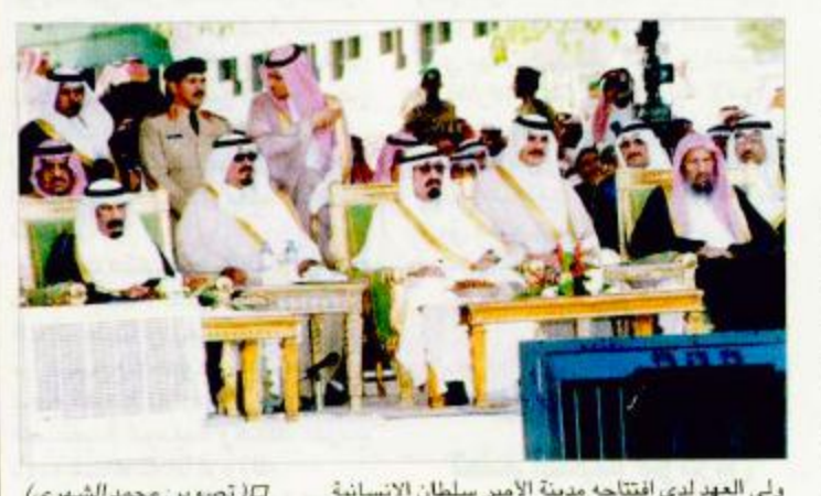
ولي العهد لدى افتتاحه مدينة الأمير سلطان الإنسانية

إن شاء الله لخدمة الإسلام والمسلمين والشعب السعودي وشركاءه... بعدها تشرّف منسوبو مؤسسة الأمير سلطان بن عبدالعزيز آل سعود الخيرية بالسلام على سمو ولي العهد. ثم قام صاحب السمو الملكي الأمير عبدالله بن عبدالعزيز بجولة في المبنى شملت غرف العمليات والعناية المركزة كما اطل من شرفة المبنى حيث شاهد من خلالها منشآت المدينة واستمع إلى شرح عنها.