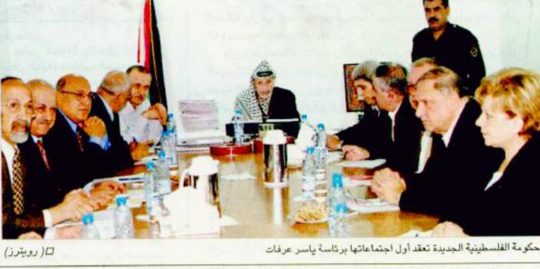
الحكومة الفلسطينية الجديدة تعقد أول اجتماعاتها برئاسة ياسر عرفات

القدس - (ا ف ب): أعلن مصدر رسمي أن الوزراء العماليين الخمسة في حكومة رئيس الوزراء ارييل شارون قدموا استقالتهم أمس الأربعاء اثر الفضل في التوصل إلى تسوية لانقاذ الحكومة الإسرائيلية الائتلافية من التفتك. وقد قدم وزير الدفاع بنيامين بن بيهان استقالته أولاً وتبعه في ذلك وزير الخارجية شيمون بيريز والوزيرية مائتان فيلينا. ثم استقالت وزيرة الصناعة داليا اسحق ووزير النقل افراميم سنيه. وأسفرت استقالة الوزراء العماليين عن انهيار الحكومة بعد عشرين شهراً من تشكيلها وأعلن سكرتير الحكومة جديعون سارن ان هذه الاستقالات ستصبح نافذة في غضون ٤٨ ساعة. وقد استقال الوزراء العماليون احتجاجاً على الاعتمادات المخصصة للاستيغان اليهودي في موازنة ٢٠٠٣. وصوت البرلمان الإسرائيلي أمس الأربعاء لمصلحة موازنة التقشف للعام ٢٠٠٣ في قراءة أولى بغالبية ٦٧ صوتاً مقابل ٤٥ صوتاً معارضا في حين امتنع نائبان عن التصويت. ويأتي هذا الانشقاق في الوقت الذي عقدت فيه الحكومة الفلسطينية الجديدة بعد منحها الثقة أول جلساتها.