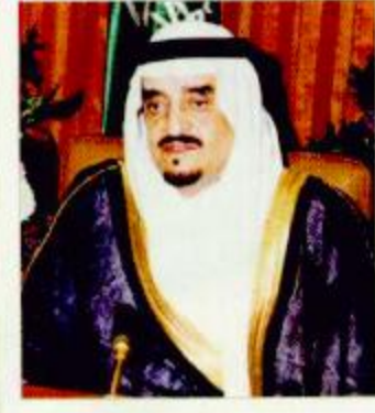
أمر ملكي تعيين فهد بن بدر أميراً للجوف

رعى صاحب السمو الملكي الأمير عبدالله بن عبدالعزيز ولي العهد نائب رئيس مجلس الوزراء ورئيس الحرس الوطني أمس حفل افتتاح مدينة الأمير سلطان بن عبدالعزيز للخدمات الإنسانية بالرياض. وكان في استقبال سموه لدى وصوله مقر المدينة صاحب السمو الملكي الأمير سلطان بن عبدالعزيز الثاني نائب الرئيس لمجلس الوزراء وزير الدفاع والطيران والمفتش العام الرئيس الأعلى لمؤسسة سلطان بن عبدالعزيز آل سعود الخيرية ورئيس مجلس الأمناء وصاحب السمو الملكي الأمير سلمان بن عبدالعزيز أمير منطقة الرياض وصاحب السمو الملكي الأمير خالد بن سلطان بن عبدالعزيز مساعد وزير الدفاع والطيران والمفتش العام للشؤون العسكرية وصاحب السمو الملكي الأمير فيصل بن سلطان بن عبدالعزيز أمير منطقة القصيم وصاحب السمو الملكي الأمير تركي بن سلطان بن عبدالعزيز مساعد وزير الإعلام ومدير عام المؤسسة الدكتور راشد ابوالخيل. وفور وصول سموه عزّف السلام الملكي ثم صافح سموه مستقبليه من أصحاب السمو الملكي الأمراء بعد ذلك قدم طفلان لسمو ولي العهد باقتين من الورود ترحيباً بقدوم سموه. إثر ذلك تفضل صاحب السمو الملكي الأمير عبدالله بن عبدالعزيز بإزاحة الستار عن اللوحة التذكارية لمدينة الأمير سلطان بن عبدالعزيز للخدمات الإنسانية أياً بافتتاحها قائلاً «بسم الله الرحمن الرحيم وعلى يد الله