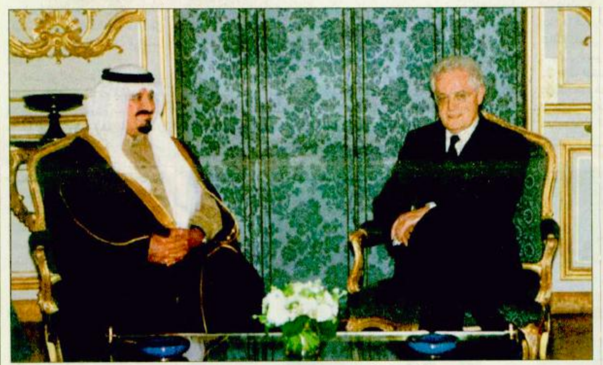
○ سمو النائب الثاني في أثناء مباحثاته مع رئيس وزراء فرنسا ○ واس

إيضاح من مصدر سعودي مسؤول : لا وجود لمبادرة سعودية لاستضافة المعارضة والحكومة السودانية ○ الرياض - واس : بناء على ما تناقلته مختلف وسائل الإعلام عن وجود مبادرة سعودية لاستضافة اجتماع يضم مختلف الفصائل السودانية المعارضة والحكومة السودانية فقد علمت وكالة الأنباء السعودية عن مصدر مسؤول ان ذلك الأمر لم يعاود من المعارضة السودانية ذاتها التي ذكرت ان لديها عرضاً من الحكومة السودانية ببدء المفاوضات فيما بينهم على أرض المملكة العربية السعودية. وأفاد المصدر ان ذلك تم منذ مدة تتراوح ما بين خمسة إلى ستة شهور وقد أجمعت الملكة في حينه بأنه اذا كانت كل الفصائل والحكومة السودانية موافقة على ذلك فإن الملكة ترحب باستضافة الاجتماع مادام انه يرضي كل الفصائل المعارضة والحكومة السودانية. وأضاف المصدر انه منذ ذلك الحين لم يرد خبر عن هذا الموضوع وليس هناك أية مبادرة من قبل الملكة لا الآن ولا في ذلك الحين.