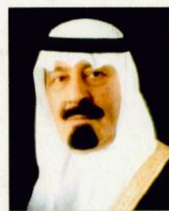
الأمير عبد الله بن عبد العزيز

عمان - واس: يتبادل أصحاب الجلالة والسمو قادة دول مجلس التعاون لدول الخليج العربية في قمته التشاورية نصف السنوية اليوم الأحد في جدة الأزاه حول ما يتعلق بمسيرة التعاون المشترك بين دولهم كما يبحثون المستجدات الإقليمية والدولية. وقال عبدالرحمن العطية الأمين العام لمجلس التعاون إن القمة التي ستعقد بدون جدول أعمال تستغرق يوماً واحداً وإنها لن ترفع توصيات بل سيكتفي القادة بإصدار توجيهه للأمين العام فيما يرون متابعتها أو اتخاذ إجراء بشأنه. يذكر أن الاجتماع التشاوري الأول عقد عام 1999م في المملكة العربية السعودية والاجتماع الثاني عام 2000م في سلطنة عمان والاجتماع الثالث 2001م في مملكة البحرين. ونيابة عن خادم الحرمين الشريفين الملك فهد بن عبدالعزيز آل سعود يرعى نائب خادم الحرمين الشريفين صاحب السمو الملكي الأمير عبدالله بن عبدالعزيز آل سعود حفل افتتاح أعمال السنة الثانية من أعمال مجلس الشورى في دورته الثالثة ويتفضل بالقاء الخطاب الملكي السنوي في مجلس الشورى، وذلك يوم الأربعاء القادم الموافق 17 ربيع الأول 1423هـ في مقر المجلس بالرياض بمشيئة الله. وأوضح معالي رئيس مجلس الشورى الدكتور صالح بن عبدالله بن حميد في تصريح لوكالة الأنباء السعودية أن الخطاب الملكي الكريم سينتظم سياسة الدولة الداخلية والخارجية، معرباً باسمه ونيابة عن أعضاء مجلس الشورى عن سعادتهم بهذه المناسبة..... طالع ص 19