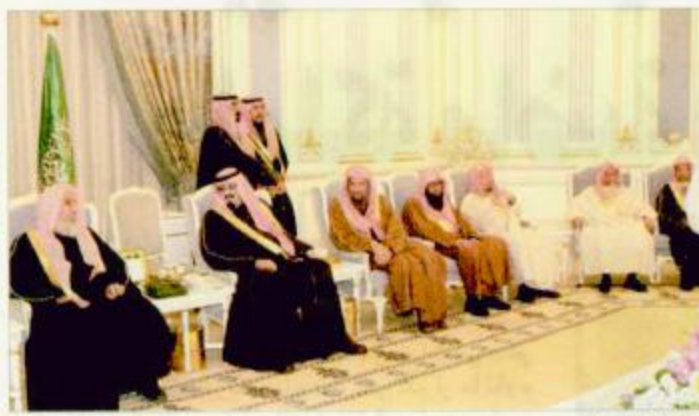
الأمير عبد الله خلال استقباله المشايخ

لغة العقل هي ما تبقى.. والساحة لا تزال تتسع لبعض التفاوض!