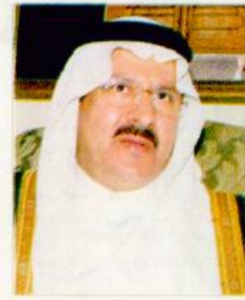
الأمير عبدالمجيد بن عبدالعزيز دراسة وتطوير الأنشطة الشبابية والرياضية برئاسة أحمد الزامل

اعتمد صاحب السمو الملكي الأمير عبدالمجيد بن عبدالعزيز أمير منطقة مكة المكرمة رئيس لجنة دراسة وتطوير الوضع الرياضي والشبابي في المملكة تأجيل موعد عقد فعاليات ورشة العمل الخاصة باللجان الأربع للتطوير الرياضي المتبقي عن اللجنة الرئيسية لدراسة وتطوير الوضع الرياضي والشبابي في المملكة لجنة دراسة وتطوير كرة القدم برئاسة إبراهيم أفندي ولجنة تنمية الموارد المالية للأنشطة برئاسة عبدالرحمن الجريسي، لجنة دراسة الأنشطة والولائم برئاسة محمد فقي ولجنة