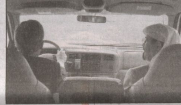
بوش يتودد شاحنة برهفة الأمير عبدالله في جولة على المزرعة