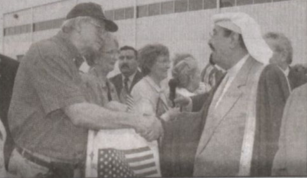
الأمير عبدالله يصافح مواطنين أمريكيين شقيق وأن صغرى في المملكة

دالاس - أحمد حسين اليامي، قال السفير فوري بن عبد العزيز شبيكتي، سفير المملكة العربية السعودية لدى الأمم المتحدة، إن زيارة ولي العهد الأمير عبدالله بن عبدالعزيز آل سعود إلى الولايات المتحدة تأتي دعماً لمصالح المملكة وسنداً للقضايا العربية والإسلامية. وقال شبيكتي: «إن زيارة ولي العهد الأمير عبدالله بن عبدالعزيز آل سعود إلى الولايات المتحدة تأتي دعماً لمصالح المملكة وسنداً للقضايا العربية والإسلامية. وقال شبيكتي: «إن زيارة ولي العهد الأمير عبدالله بن عبدالعزيز آل سعود إلى الولايات المتحدة تأتي دعماً لمصالح المملكة وسنداً للقضايا العربية والإسلامية».