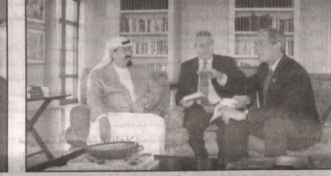
اجتماع عمال بين بوش والأمير عبدالله في المزرعة