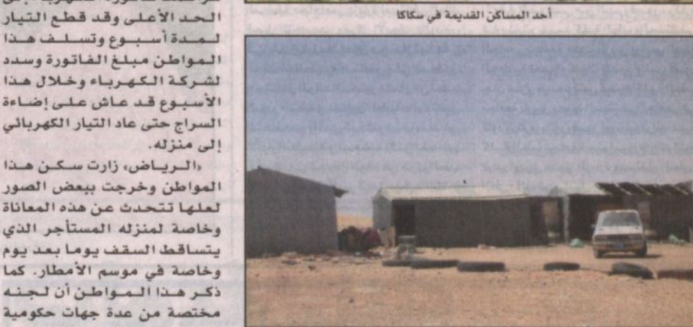
أحد المساكن القديمة في سكاكا

الرياض، زارت سكن هذا المواطن وخرجت ببعض الصور لعلها تتحدث عن هذه المعاناة وخاصة لمنزله المستأجر الذي يستأجره السقف يوماً بعد يوم وخاصة في موسم الأمطار. كما ذكر هذا المواطن أن لجنة مختصة من عدة جهات حكومية قبل عدة سنوات ماضية باكتشف على المنزل ولكن للأسف لم تتغير الحال وقد أذات اللجنة أن هذا المنزل غير صالح للسكن من خلال تقرير احد بذلك ويحفظ بصورة لديه من هذا التقرير. ويضيف هذا المواطن أن حلمه هو الحصول على منزل يحتويه هو وابنته وزوجته ويسدد ديونه المتراكمة والتي أنهكته كثيراً.. وحينما أخبرناه بهذه المكرمة حمد الله كثيراً داعياً الله أن يحفظ هذه اليد قادتها متمنياً أن يعطى وأسرته بمنزل يكفيه هذا العناء..