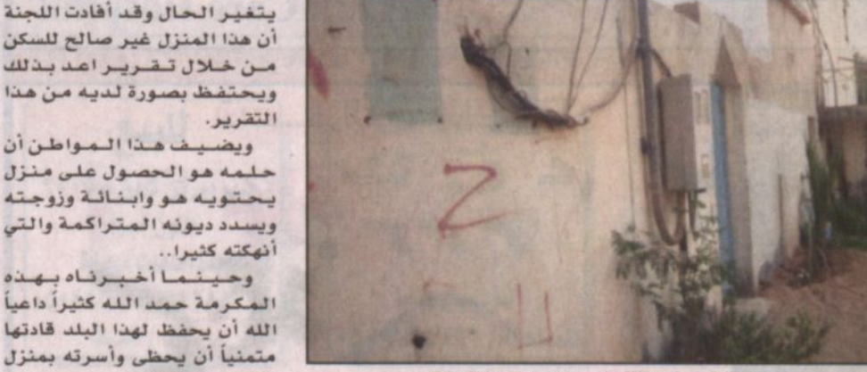
منزل قديم في سكاكا يعاني من عدم البنية التحتية

عذرة - عبدالرحمن البقمي، نوه عدد من المسؤولين بمحافظة عذرة بتوجيهات صاحب سمو الملكي الأمير عبدالله بن عبدالعزيز ولي العهد نائب رئيس مجلس الوزراء رئيس الحرس الوطني بتخصيص مليار ريال من فائض الميزانية لمشاريع الإسكان الشعبي وقالوا في تصريح لـ«الرياض» أن هذا الدعم والتوجيه من سمو الكريم ليس بغريب فقد تبني حفظه الله قبل ذلك صندوق معالجة الفقر وهو أحد الاهتمامات التي أشرف عليه سموه بنفشه إبان جولاته التفقدية للأحياء الفقرية في مدينة الرياض. وأجمعوا بأن هذا التخصيص سيوفر السكن المريح لكل محتاج في مدن ومحافظات ومراكز المملكة وسيدعم الأسر المحتاجة. وقال المرشح لعضوية المجلس البلدي الشيخ سامي بن صالح الغريز: الحمد لله والصلاة والسلام على المبعوث رحمة للعالمين وعلى آله وصحبه والتابعين، حقيقة استبشرت خيراً ولم أملك نفسي من الفرح لما سمعت بصدور أوامر صاحب السمو الملكي الأمير عبدالله بن عبدالعزيز ولي العهد نائب رئيس مجلس الوزراء رئيس الحرس الوطني بتخصيص مبلغ مليار ريال من فائض الميزانية لصالح الإسكان الشعبي. ولا شك أن المؤمن يفرح لاخواته