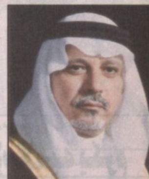
د. ناصر الصالح

مكة المكرمة - خالد الجامعي، نوه معالي مدير جامعة أم القري الأستاذ الدكتور ناصر بن عبدالله الصالح بتوجيه صاحب السمو الملكي الأمير عبد الله بن عبد العزيز ولي العهد نائب رئيس مجلس الوزراء رئيس الحرس الوطني بتخصيص مبلغ مليار ريال لصالح الإسكان الشعبي لجميع مناطق المملكة قائلاً إنه يأتي امتداداً لعملاء الخير والتماء بمملكتنا الحبيبة. مشيراً أن هذا المبلغ سوف يرفع من نمط الحياة الاجتماعية