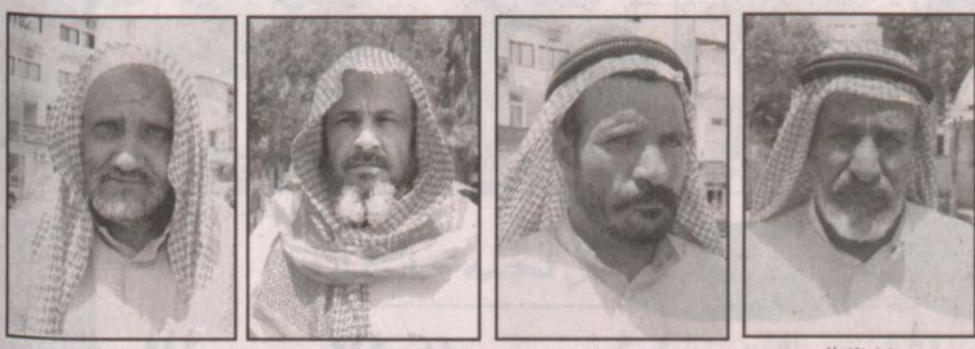
عبدالله بن عبدالعزيز - الطائف - أحمد حسن الزهراني