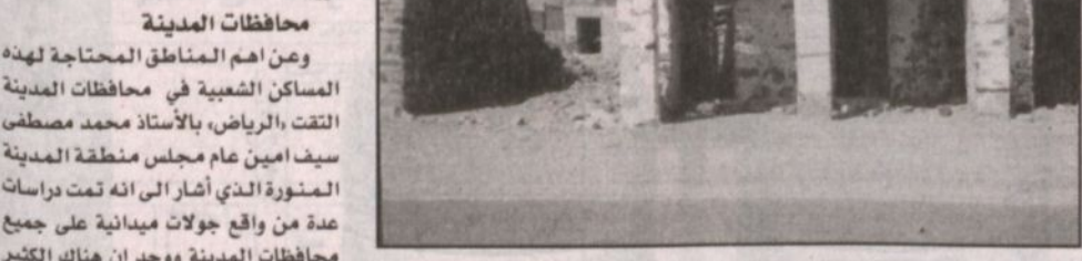
منزل متاهلك داخل المدينة بحاجة لاستيلاءه

المدينة المنورة - سالم الأحمدى، تصوير - يوسف سفر، أحيا توجيه سمو ولي العهد - حفظه الله - بتخصيص ملياري ريال لمباني الإسكان الشعبي في مناطق المملكة بمنطقة المدينة المنورة بأن يحصلوا على مساكن لائقة. واجمع عدد من المواطنين التقهم بالرياض، بأن هذا الأمر احيا الأمل في نفوسهم وجعل كلمة الانتظار وقفاً أجمل وللحياة طمعاً أحسن بعد ان ملوا الانتظار والوعود التي سمعوا كثيراً من القطاعات المسؤولة عنهم.