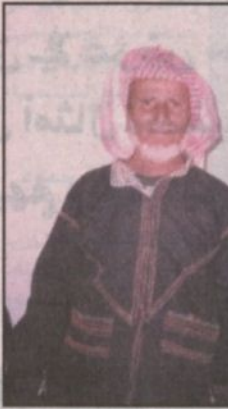
علي غرامة وعبود زيد

وفي الختام، وفي شمال منطقة عسير بمركز بللمسر أوضح لـ (الرياض)، مدير الجمعية الخيرية ببللمسر الشيخ محمد بن زرقان الأسمرى بأن عدد الأسر الفقيرة في المنطقة والمسجلة بالجمعية ما يقارب (١١٣) أسرة تكفلت الجمعية بكافة عدد مائة أسرة فقيرة هناك ولا زالت المنطقة تحتاج لدعم المادي لتزويد دورها الكامل لتوفير ما يمكن توفيره للأسرة الفقيرة.