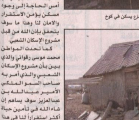
أحد المسنين في مقرع يسكن في كوخ