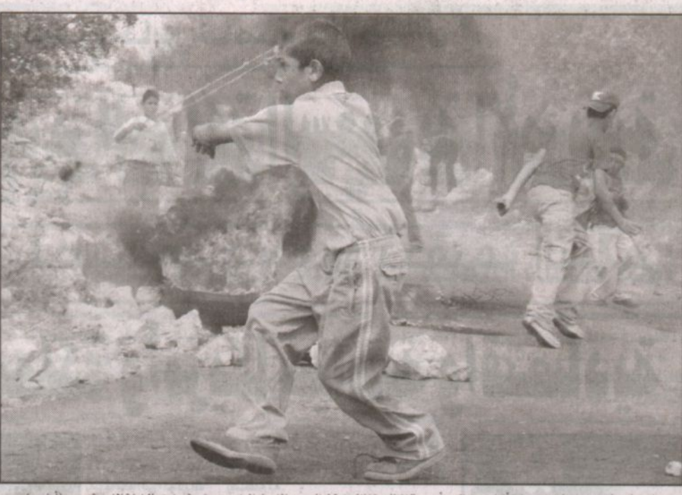
فتية فلسطينيون ينفذون الحجارة أثناء اشتراكهم أمس في المظاهرة المناهضة لبناء سور الفصل العنصري يفرضه بينين بالضفة الغربية.