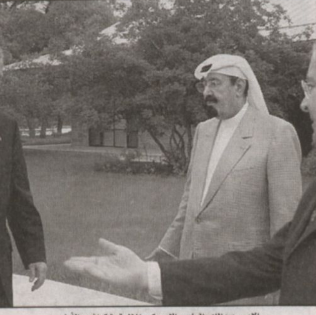
الأمير عبد الله والرئيس الأمريكي جورج دبليو بوش

وأضاف وولكر في حديث لـ «الرياض»، انه لو اعتمدت العلاقات الثنائية بين المملكة العربية السعودية - الأمريكية في (كراهورد) بولاية تكساس.