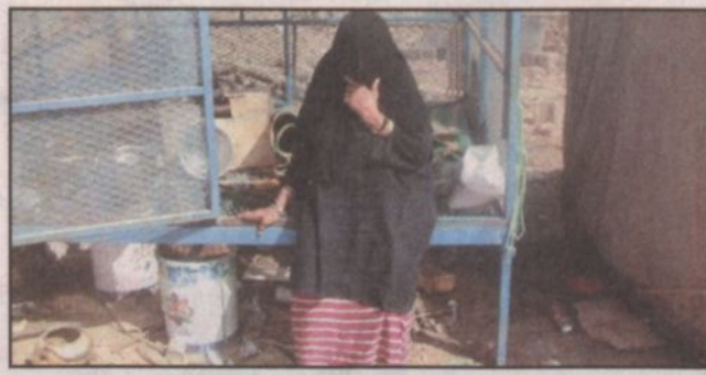
إحدى المواطنات ومعامنة مع الفرح