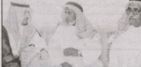
سموه مع والد الشهيد ووالد زوجة الشهيد

عتيبة - صالح الجهني قام صاحب السمو الملكي الأمير عبدالعزیز بن ماجد بن عبدالعزيز نائب أمير منطقة القصيم ظهر أمس بزيارة إلى منزل شهيد الواجب محمد بن غازي المطيري بحي السليمانية بمحافظة عنيزة وكان في استقباله محافظ عنيزة المهندس مساعد بن يحيى السليم ووالد الشهيد الشيخ غازي المطيري ووالد زوجة الشهيد الشيخ راشد شواب المطيري وأقارب الشهيد. ونقل سموه تعازي القيادة إلى أسرته ثم داعب سموه كريمات الشهيد أمجات (ست أعوام) ووجدان (أربعة أعوام) ونجلاء (سنتان) بأبوة حانية. وصرح سموه بقوله: أسأل الله أن يفرح له ويرحمه ويتقبله مع الشهداء.. الحمد لله أتبنا إلى بيت عرف الله