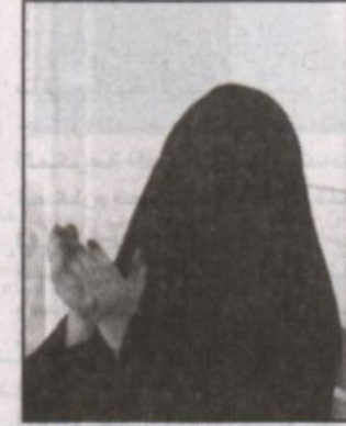
أم محمد ترفع أكف الضراعة لحادم الحرمين على مكرمه السخية