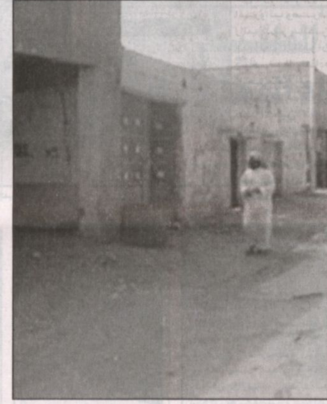
أعد أحياء حائل الفخيرة