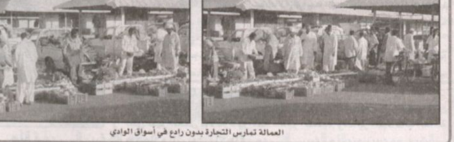
العمالة تمارس التجارة بدون راحة في أسواق الوادي

وادي الدواسر - عبدالله الحمدان الزائر للأسواق التجارية بوادي الدواسر يلاحظ جودة البضاعة للعمالة الوافدة لتزاول البيع والشراء في ظاهرة تجلبت فصولها للعيان في سوق الخضار والفواكه والبرسيم والورد والاشنان وسوق