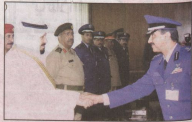
الأمير عبدالرحمن خلال الاستقبال

جدة - واس ■ استقبل صاحب السمو الملكي الأمير عبدالرحمن بن عبد العزيز نائب وزير الدفاع والطيران والمفتش العام في مكتب سموه بجدة امس الملحقين العسكريين السعوديين وضباط الاتصال بالخارج الذين قدموا للسلام على سموه. وتمنى سموه للملحقين العسكريين التوفيق والسداد في مهام عملهم وحثهم على تقديم الصورة الحسنة للمملكة في الملحقيات التي يعملون بها. حضر الاستقبال صاحب السمو الملكي الأمير خالد بن سلطان بن عبدالعزيز مساعد وزير الدفاع والطيران والمفتش العام لشؤون العسكرية ورئيس هيئة استخبارات وأمن القوات المسلحة اللواء الركن عبدالرحمن المرشد.