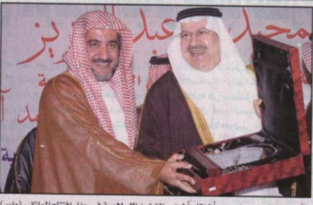
الأمير عبدالمجيد يقدم درعاً تذكاريًا لوزير الشؤون الإسلامية في حفل افتتاح الملتقى

وفي نهاية الحفل قدم سموه درعاً تذكاريًا لمعالي وزير الشؤون الإسلامية والأوقاف والدعوة والإرشاد بهذه المناسبة. كما قدم المهندس عبدالعزيز حنفي رئيس جمعية تحفيظ القرآن الكريم بمحافظته جدة -الجهة المنظمة- درعاً تذكاريًا لسموه بهذه المناسبة.