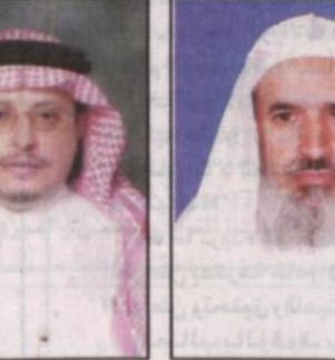
سعيد بن سلطان