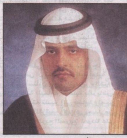
الأمير عبدالعزيز بن سعد