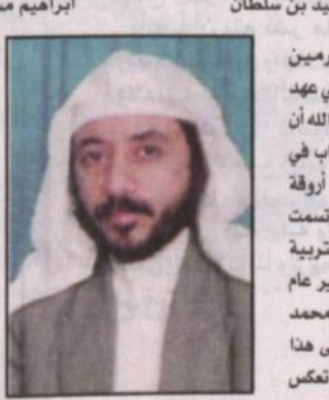
سعيد بن سلطان

الاجتماعي وتعاليت الأصوات لتنهج بالهداء لخادم الحرمين الشريفين (الملك عبد الله بن عبد العزيز آل سعود) وسمو ولي عهد الأمين بالخير والأمان في كل زمان ومكان راجين من الله أن يجعل ذلك في ميزان حسناتهما وأن يجزل لهما الأجر والثواب في الدنيا والآخرة.