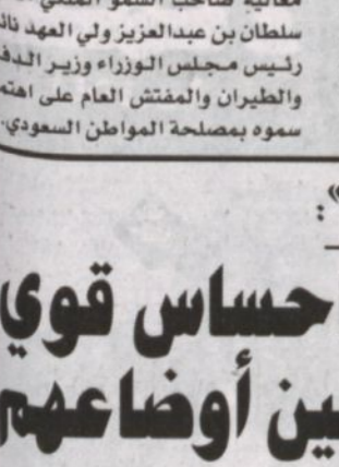
اللواء عبدالله التهراني

كتبت - مناحي الشيباني، هذا المبادرة التي تعتبر باكورة خير لعهد خير ويشري تئين عن مستقبل مشرق لمواطني هذا الوطن الكريم، وينم عن رؤية واضحة للقيادة الرشيدة لاحتياجات المواطن وتطلعاته في ظل الأوضاع الاقتصادية الحالية وكثرة المتطلبات المعيشية التي تواجه المواطن السعودي، وتمكن رغبة الدولة في تحسين المستوى المعيشي للمواطنين بجانب تحسين الخدمات العامة ودعم للاقتصاد الوطني وتحقيق للمصلحة العامة.