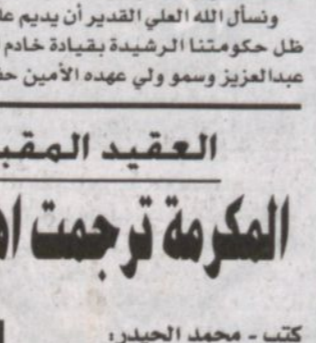
العقيد عبدالرحمن المقبل

كتبت - محمد الحجيلر، أكد العقيد عبدالرحمن المقبل مدير مرور منطقة الرياض على أن زيادة الرواتب للمواطنين من مدنيين وعسكريين تجسد مدى اهتمام الراعي بوعيته وترجم ما نتمتع به من هذه البلاد من قيادة رشيدة جعلت المواطن محور اهتمامها وما هذه المكرمة الملكية إلا خير دليل على ذلك.