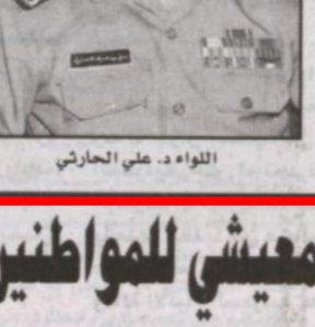
اللواء د. د. الحارثي

أكد مدير عام الشؤون اللواء الدكتور علي الحارثي على ان القرار الملكي بزيادة رواتب موظفي الدولة من مدنيين وعسكريين بنسبة ١٥ ٪ هو امتداد لمكازم ولاة الأمر حفظهم الله على شعب هذه البلاد.