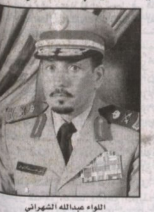
اللواء عبدالله التهراني

كتبت - مناحي الشيباني، عبر مدير شرطة منطقة الرياض اللواء عبدالله بن سعد الشهراني عن بالغ شكره وعظيم امتنانه لقيادة بمناخية صدور الأمر الكريم بزيادة رواتب الموظفين مدنيين وعسكريين من جميع القطاعات الحكومية ودعم الجمعيات الخيرية والمتقاعدين. وقال اللواء الشهراني في تصريح لـ "الرياض" إنني بهذه المناسبة لا يسعني إلا أن أرفع تحية الشكر والامتنان لقيادة عني الشريفين الملك عبدالله بن عبدالعزيز وسمو ولي عهده الأمين.