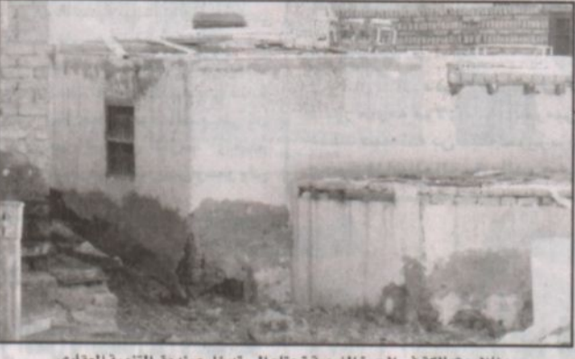
منازل متهاككة في الحرة الغربية تحتاج إلى تدخل صندوق التنمية العقاري