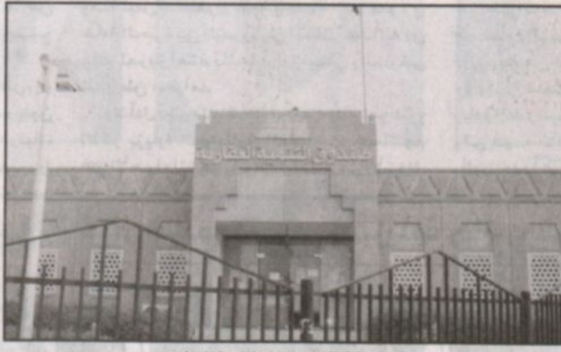
مساهمة فعالة لصندوق التنمية العقاري