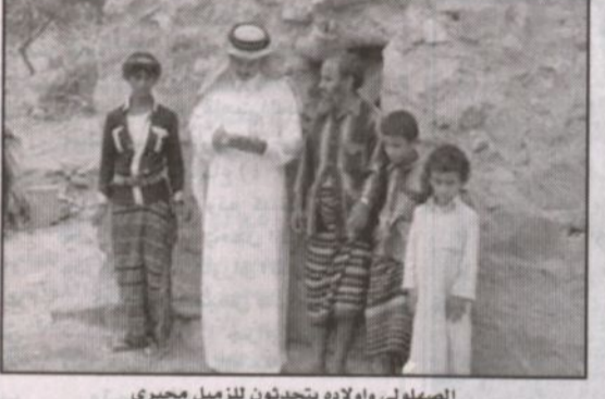
مواطن يسكن في خضرة في جبال قيس