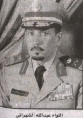
اللواء عبدالله الشهراني