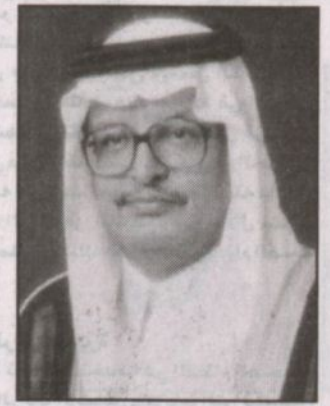
د. سعيد المليص

كتب - محمد السهلي: أوضح معالي نائب وزير التربية والتعليم لشؤون تعليم البنين الدكتور سعيد المليص أن مكرمة خادم الحرمين الشريفين الملك عبدالله بن عبدالعزيز بزيادة رواتب الموظفين تشمل أكثر من ٣٠٠ ألف معلم ومعلمة في قطاع التعليم العام إضافة إلى الموظفين على جميع القنات. وقال لـ "الرياض"، ليس ذلك بغريب على الملك عبدالله بن عبدالعزيز وليس بغريب على القيادة الرشيدة فهم يتلمسون قلمائنا بأنهم ويعالجوننا في وقتها المناسب. وهي امتداداً لسلسلة المكرمات المتوالية ونحن في وزارة التربية والتعليم نشعر بأنها ستكون حافزاً للمعلمين والمعلمات وسيكون لها