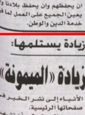
الله تعالى أكرم هذه البلاد الطاهرة بقيادة حانية تسعى لخدمة الشعب