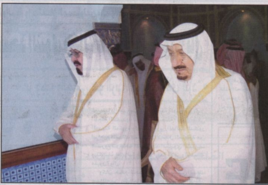
الملك عبدالله يؤدي الصلاة وإلى جواره الأمير متعب بن عبدالعزيز (و. أ. س.)