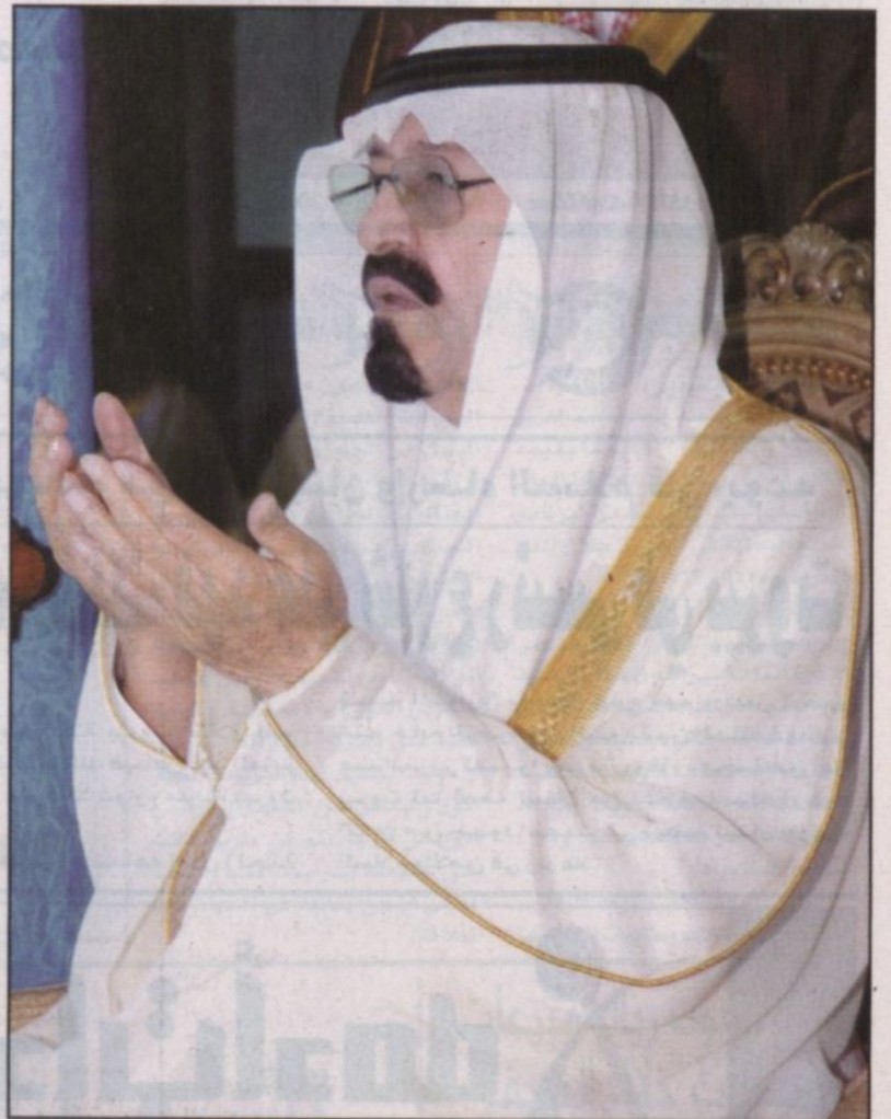
خادم الحرمين يتضرع إلى الله بالدعاء في المسجد النبوي

وقال ويصعدى لولاية المسلمين بالصلاح والمعافاة والتوفيق والساد يقول الفضيل بن عياض رحمه الله تعالى لو أن لى دعوة مستجابة لجعلتها للامان لان به صلاح الرعية فاذا صلح أمن العباد والبلاد.. وحت فضيلته المسلمين على الثبات في زمن الزواجر والمتغيرات والفتن والتقلبات وقال انه لا رسوخ لقدم ولا بقاء لمجد ولا دوام لنعز الا بالتمسك الصادق بكتاب الله وسنة رسوله صلى الله عليه وسلم لانها الميزان الحق والمقياس الصديق على طريق الخطة والخطا والصواب وليس غير الكتاب والسنة بهم وأوطاننا ان تكون أوفياء للاسلام أمنا على الاسلام فان تصان حصى الاوطان بمثل طاعة الرحمن.. وتحمس عليك النعم وديم عزك بين الامم.. وقد أدى الصلاة مع خادم الحرمين الشريفين أصحاب السمو الملكي الأمراء وأصحاب المعالي الوزراء.