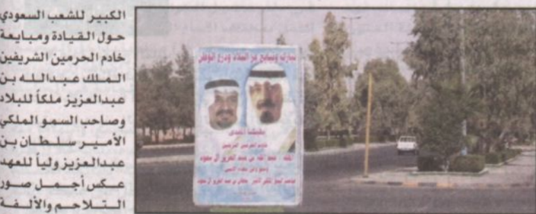
نبارك ونباع عز البلاد ودرع الوطن