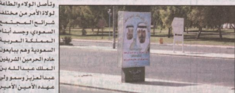
صور الملك عبدالله والأمير سلطان في أحد شوارع رفحاء

رفحاء - عيادة الجنيدى، في مشاهد ولا أجمل ولا أضيق مشاهد تعبر وبجلاء عن الوفاء والمحبة مشاهد عفوية وطبيعية مدفوعة بصندوق الولاء والطاعة للقيادة الرشيدة، حيث انتشرت في شوارع وميادين محافظة رفحاء بمنطقة الحدود الشمالية وعلى طريق الشمال الدولي المار بالمحافظة اللوحات المضيئة التي تحمل صور خادم الحرمين الشريفين الملك فهد بن عبدالعزيز وولي عهده الأمين الأمير سلطان بن عبدالعزيز في مساطق المملكة.